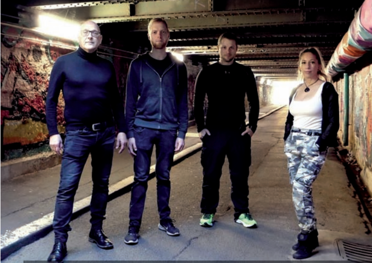
Mother's Milk und Invisible Joe & The Mushroom Gorilla (Bild) am Fr im Knubbel.