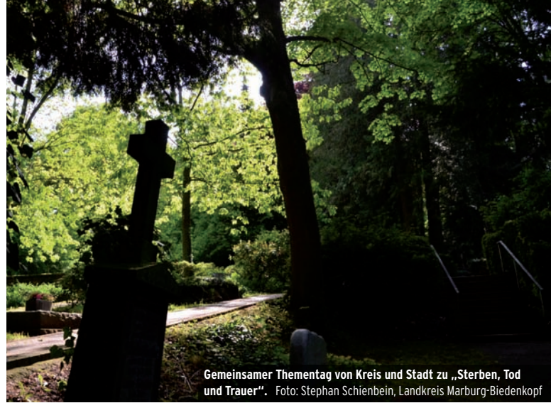
Gemeinsamer Thementag von Kreis und Stadt zu „Sterben, Tod und Trauer“.