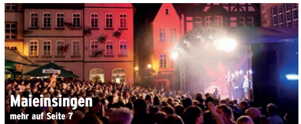
Maieinsingen mehr auf Seite 7