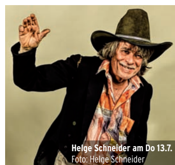
Helge Schneider am Do 13.7.