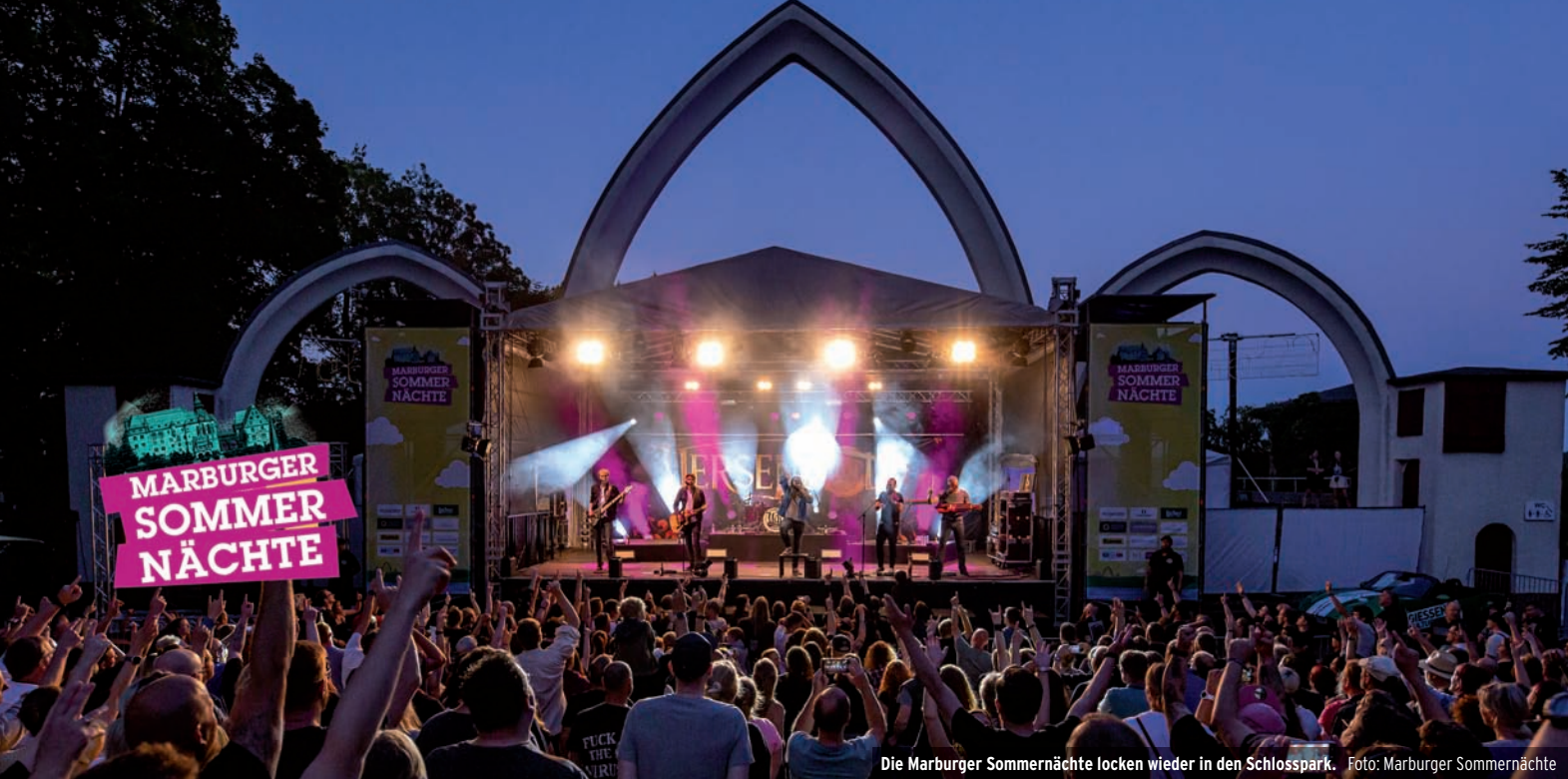
Die Marburger Sommernächte locken wieder in den Schlosspark.