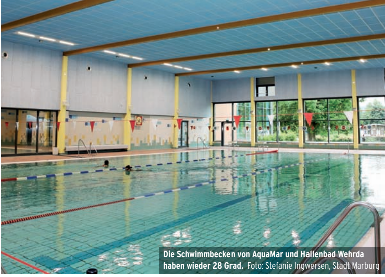
Die Schwimmbecken von AquaMar und Hallenbad Wehrda haben wieder 28 Grad.