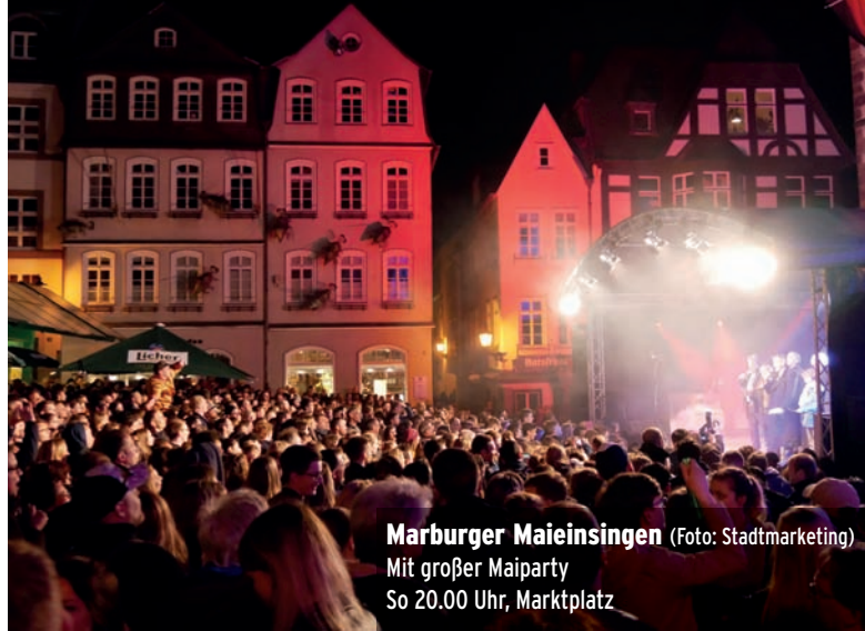
Marburger Maieinsingen Mit großer Maiparty So 20.00 Uhr, Marktplatz