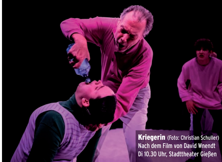
Kriegerin Nach dem Film von David Wnendt Di 10.30 Uhr, Stadttheater Gießen

Offenes Bewegungsangebot: Qi Gong Ohne Anmeldung. Infos: www.marburg.de/gesundestadt ©19.30-20.00 Gesundheitsgarten, Cappel Str. 98