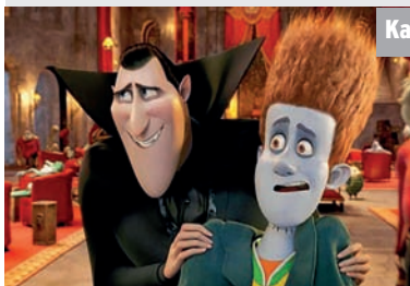
Kabel Eins - 20.15 Hotel Transsilvanien

Im „Hotel Transsilvanien“ versammelt sich eine Gästeschar von Ungeheuern, um den 118. Geburtstag von Graf Draculas Tochter Mavis zu feiern. Ein ahnungsloser Urlauber namens Jonathan klopft plötzlich an das Tor und findet sich zwischen Monstern, Mumien und Mutationen wieder.