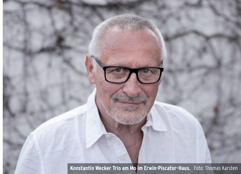
Konstantin Wecker Trio am Mo im Erwin-Piscator-Haus.