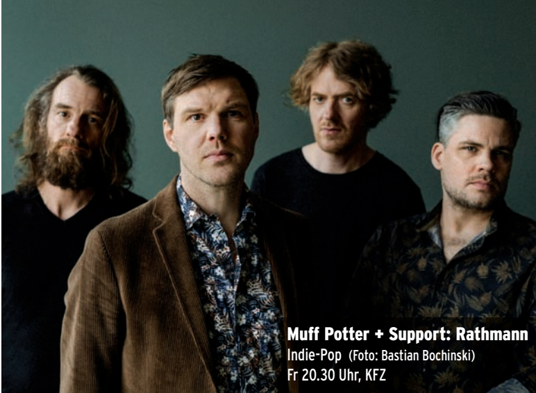
Muff Potter + Support: Rathmann Indie-Pop Fr 20.30 Uhr, KFZ