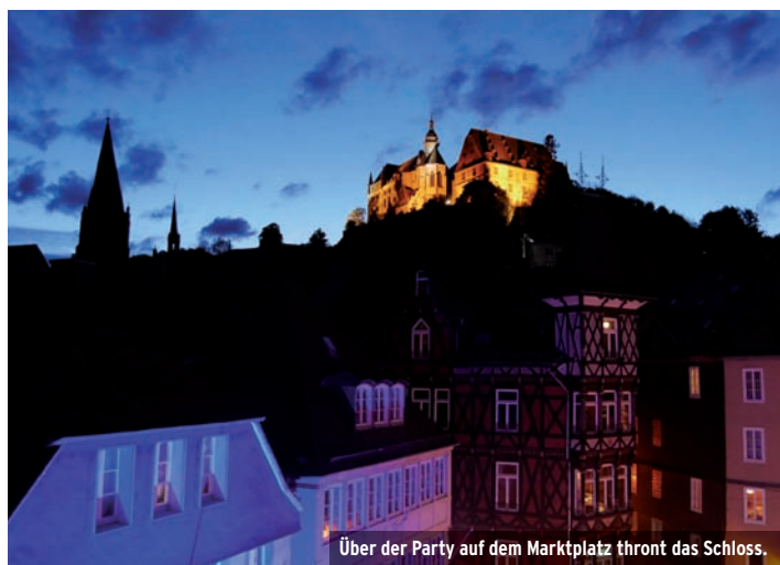
Über der Party auf dem Marktplatz thront das Schloss.

Marburger Maieinsingen & Maiparty Sonntag, 30. April 2023 Marburg, Marktplatz Beginn: 20 Uhr Eintritt: frei