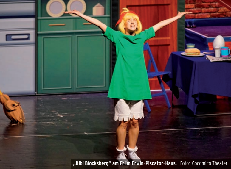
„Bibi Blocksberg“ am Fr im Erwin-Piscator-Haus. Foto: Cocomico Theater