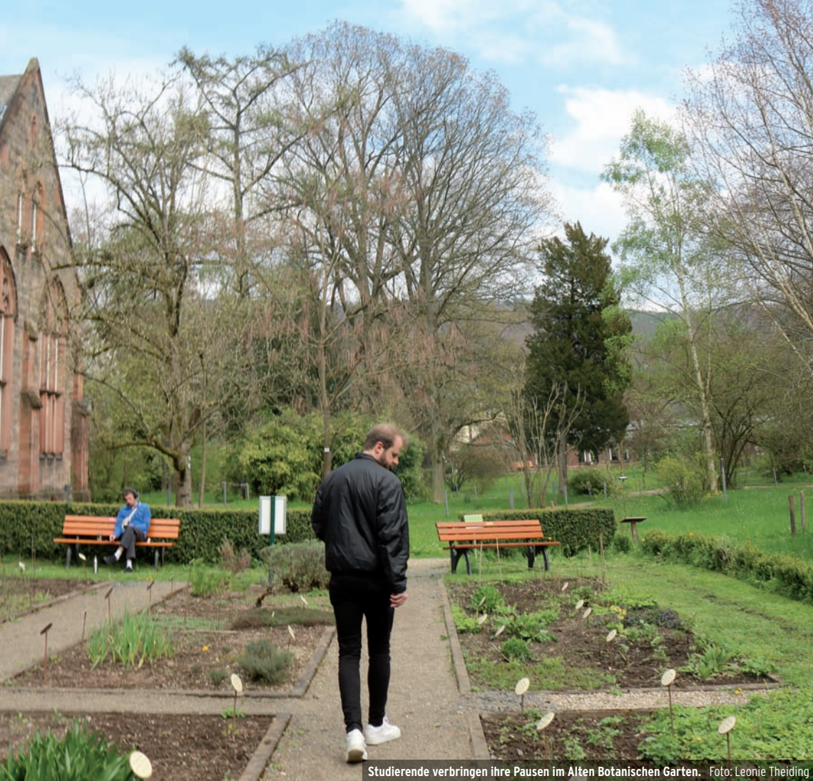
Studierende verbringen ihre Pausen im Alten Botanischen Garten.