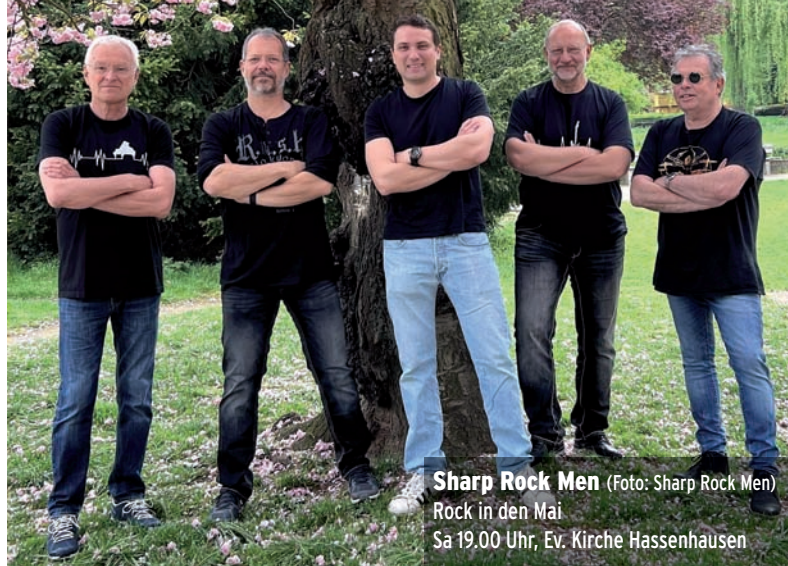
Sharp Rock Men Rock in den Mai Sa 19.00 Uhr, Ev. Kirche Hassenhausen