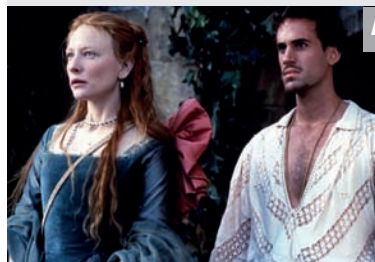
Arte - 20.15 Elizabeth

Die junge Elizabeth I. muss ihr privates Glück opfern, um ihrem Vater, dem englischen König Heinrich VIII. auf den Thron zu folgen. Dafür musste sie sich gegen Intrigen und die Machtansprüche ihrer Halbschwester durchsetzen. Ihre Liebe zu Lord Dudley muss sie deshalb aufgeben und in Einsamkeit leben.