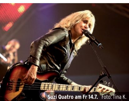
Suzi Quatro am Fr 14.7.