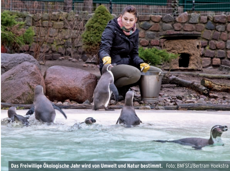
Das Freiwillige Ökologische Jahr wird von Umwelt und Natur bestimmt.