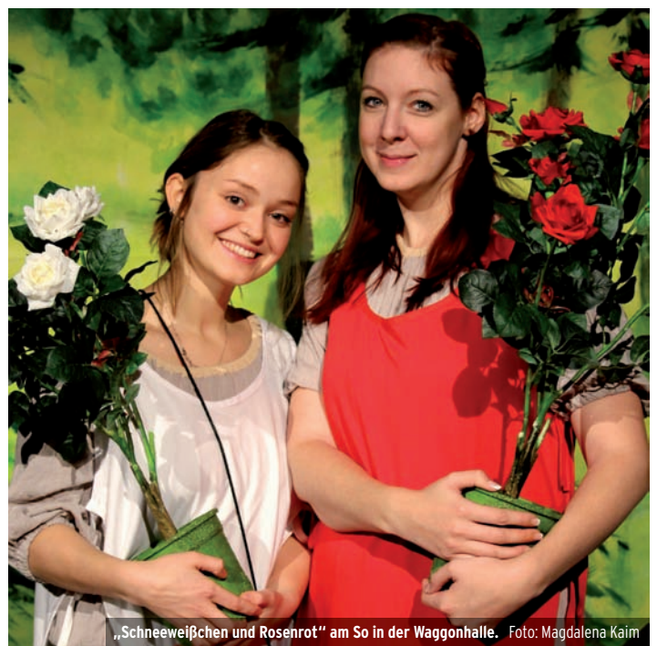
„Schneeweißchen und Rosenrot“ am So in der Waggonhalle.