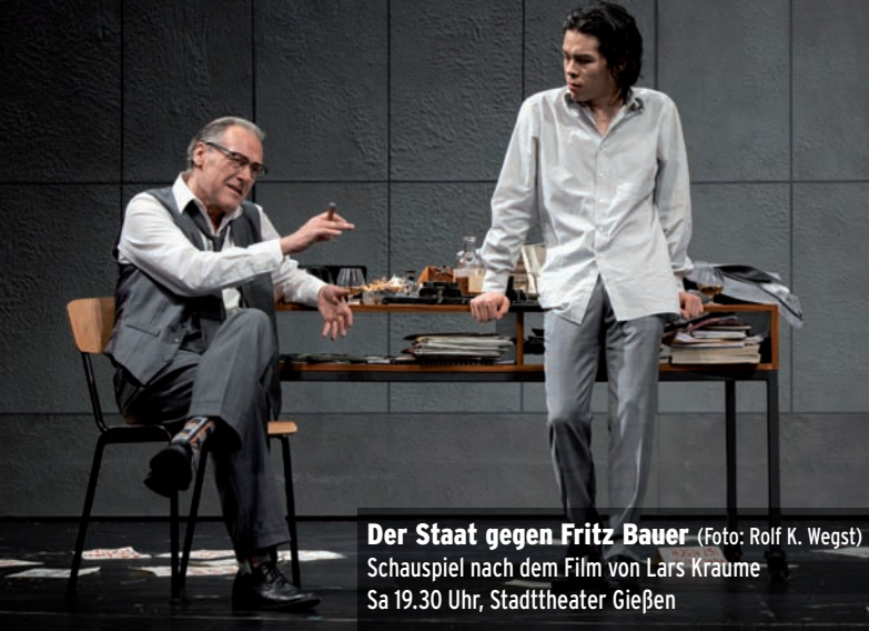
Der Staat gegen Fritz Bauer Schauspiel nach dem Film von Lars Kraume Sa 19.30 Uhr, Stadttheater Gießen