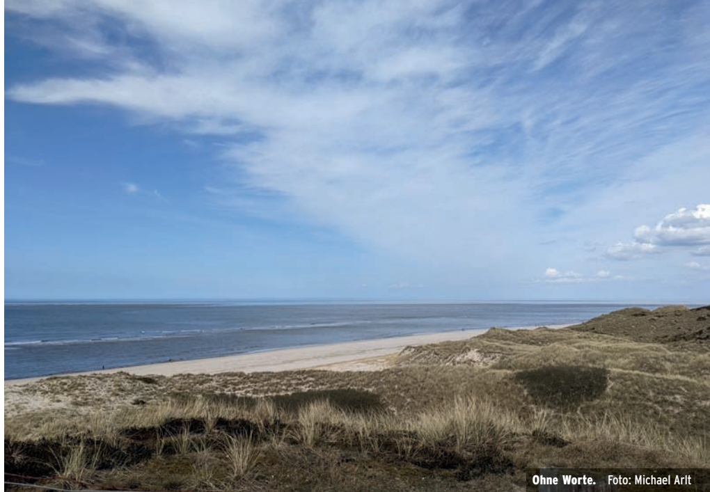
Ohne Worte.

Titelbild: Eingerahmt