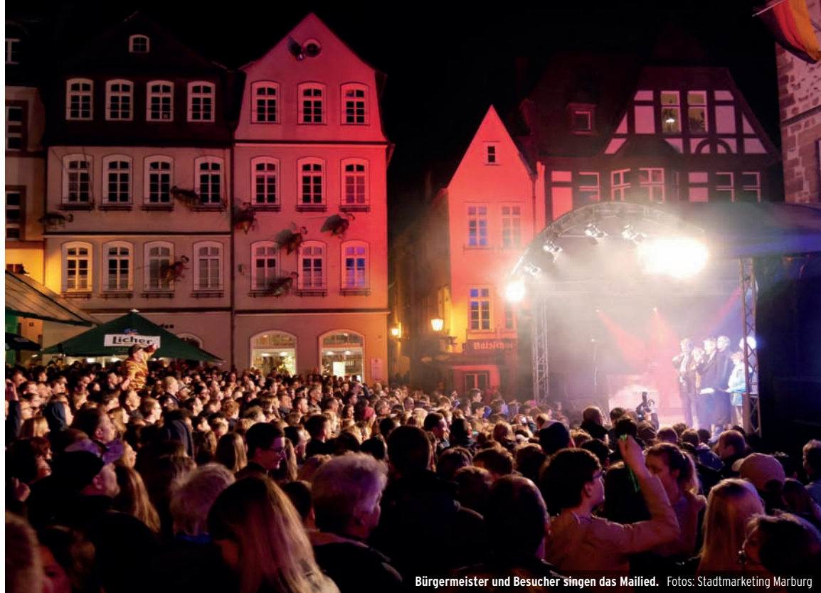
Bürgermeister und Besucher singen das Maialied.

Vor und nach dem Singen des Maialiedes feiert das Stadtmarketing mit allen Besucherinnen und Besuchern bei einer großen Maipar-