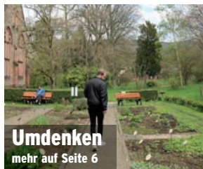
Umdenken mehr auf Seite 6