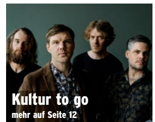
Kultur to go mehr auf Seite 12