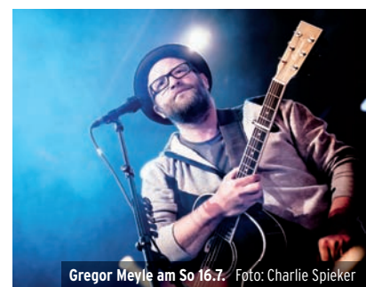
Gregor Meyle am So 16.7.