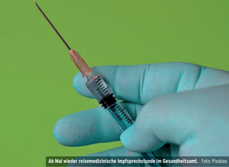
Ab Mai wieder reisemedizinische Impfsprechstunde im Gesundheitsamt.