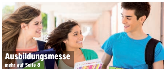
Ausbildungsmesse mehr auf Seite 8