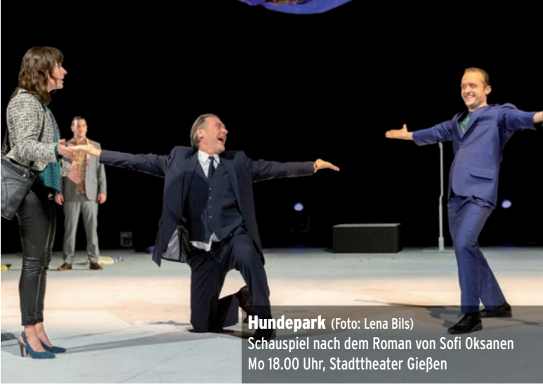
Hundepark Schauspiel nach dem Roman von Sofi Oksanen Mo 18.00 Uhr, Stadttheater Gießen

Führung im Neuen Botanischen Garten (Lahnberge) Thema: Rhododendronpracht. Tickets: www.marburg-tourismus.de oder in den Tourist-Infos. ⊙16.00-17.30 Treffpunkt: Vor den Gewächshäusern, Karl-von-Frisch-Str. 6