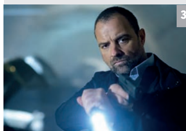
3sat - 20.15 Spuren des Bösen

Richard Brock ist vom Dienststellenleiter Mesek zu einem Tatort gerufen worden. In der Siedlung, in der nur Polizisten wohnen, erfährt er, dass der ehemalige Polizeibeamte Reiser bewaffnet geflohen ist. Er hat vermutlich seinen eigenen Sohn umgebracht.