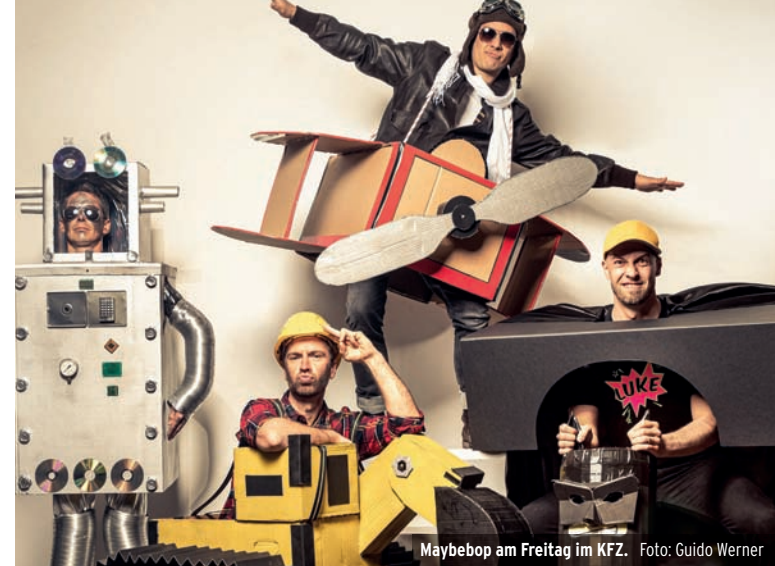
Maybepop am Freitag im KFZ.