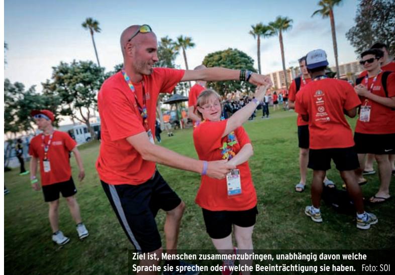
Ziel ist, Menschen zusammenzubringen, unabhängig davon welche Sprache sie sprechen oder welche Beeinträchtigung sie haben.