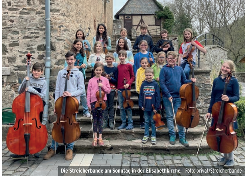
Die Streicherbande am Sonntag in der Elisabethkirche.

ganzen Welt - und tanzen gleichzeitig. Ein Höhepunkt ist das Stück „The Lord of the Dance“. Unterstützt wird die Streicherbande von den Schwanstreichern der Musikschule Marburg unter der Leitung von Diana Metzting, den Streicherflößen sowie einem jungen Streichquartett, das dänische Fiddletunes spielen wird.