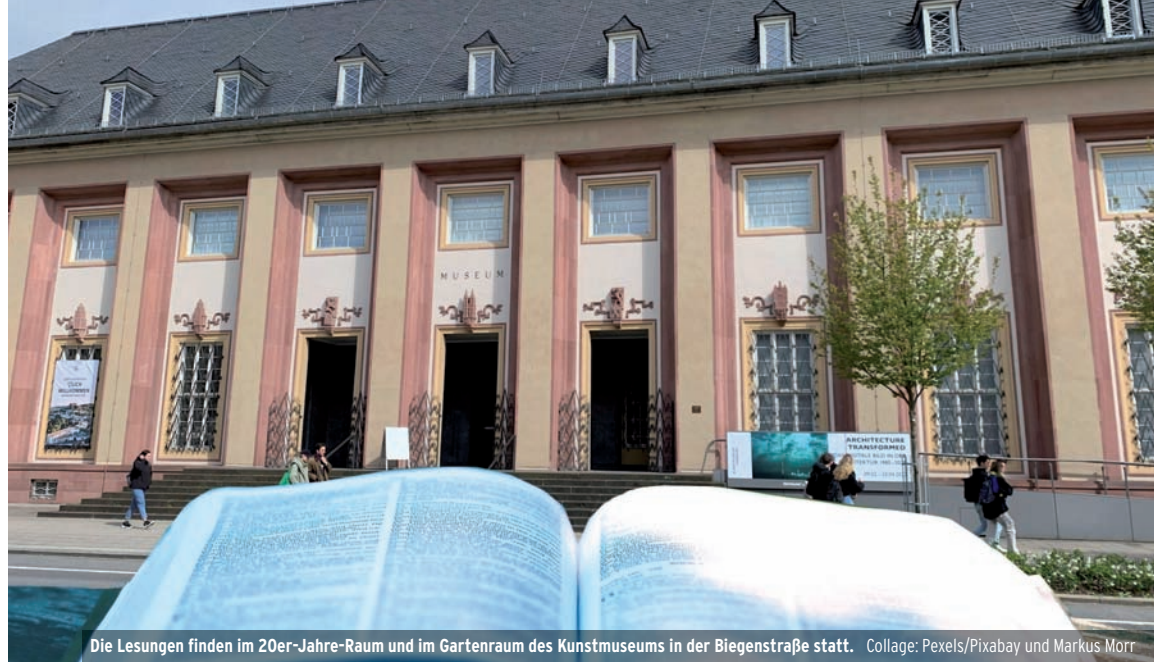
Die Lesungen finden im 20er-Jahre-Raum und im Gartenraum des Kunstmuseums in der Biegenstraße statt.

Auch Schülerinnen und Schüler aus dem Projekt „SchreibKunst“ sind mit dabei. Während die heimischen Literaturvereine selbst Autorinnen und Autoren aus ihren Mitgliedern ausgewählt haben, konnten sich freie Schriftstellerinnen und Schriftsteller bewerben, die mindestens einen Zweitwohnsitz im Landkreis haben. Über ihre Teilnahme entschied eine Jury, bestehend aus Vertreterinnen und Vertretern der mitwirkenden