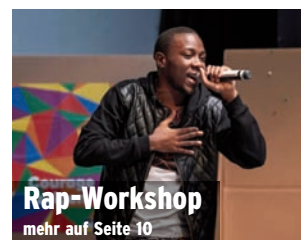
Rap-Workshop mehr auf Seite 10