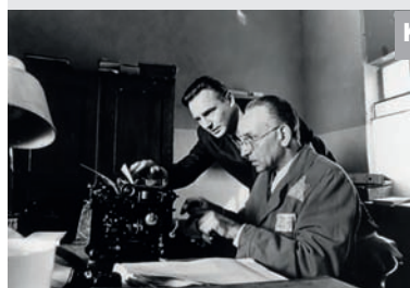
Kabel 1 - 20.15 Schindlers Liste

Deutschland 1939. Oskar Schindler hat für Geschäfte den richtigen Riecher. Er baut in Polen eine Fabrik auf, als Arbeitskräfte dienen ihm kostengünstige Juden. Mit der Zeit erkennt er allerdings den menschenverachtenden Plan der Nazis.