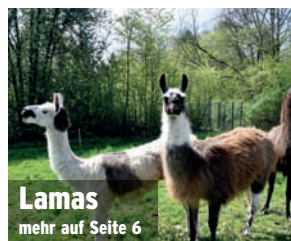
Lamas mehr auf Seite 6