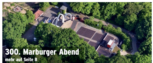
300. Marburger Abend mehr auf Seite 8