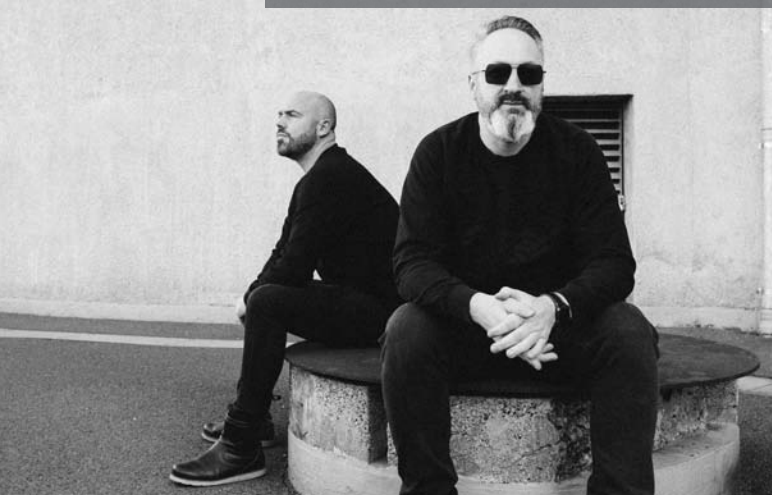
Das Duo Kaiserdisco ist Headlines des Festivals.