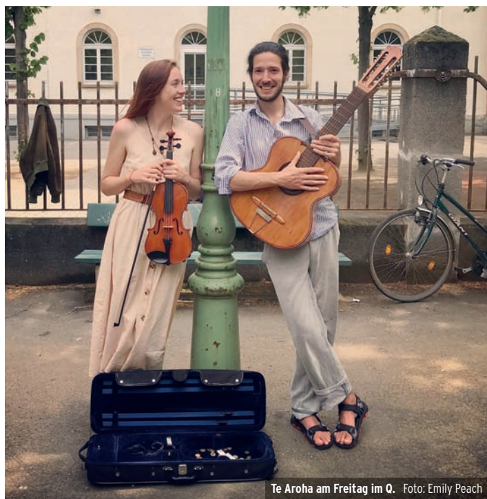
Te Aroha am Freitag im Q.