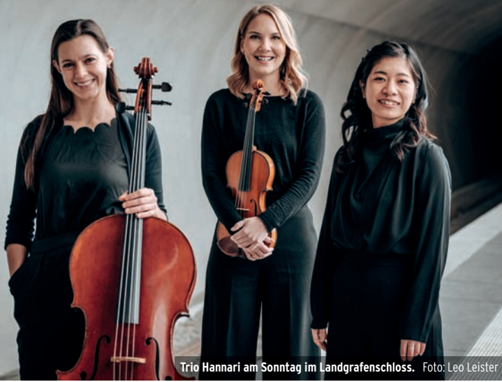
Trio Hannari am Sonntag im Landgrafenschloss.