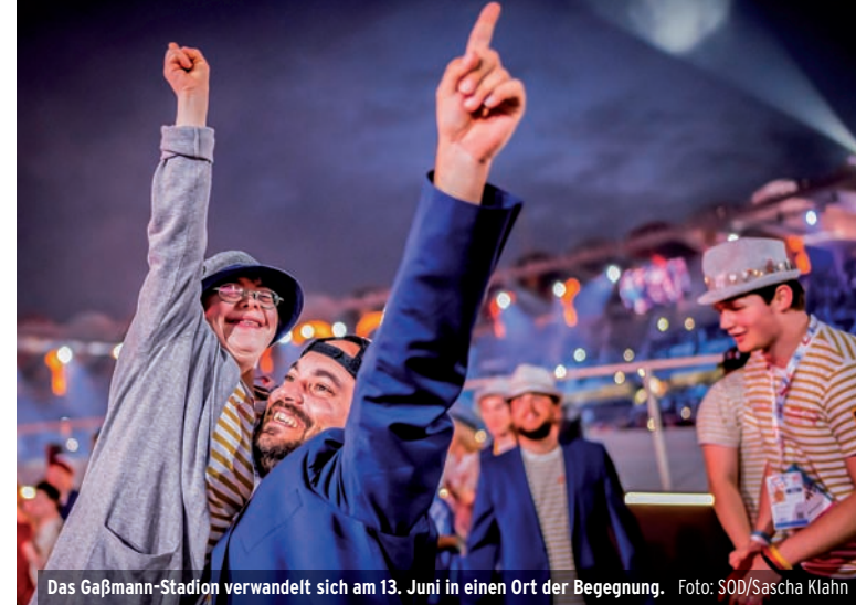
Das Gaßmann-Stadion verwandelt sich am 13. Juni in einen Ort der Begegnung.