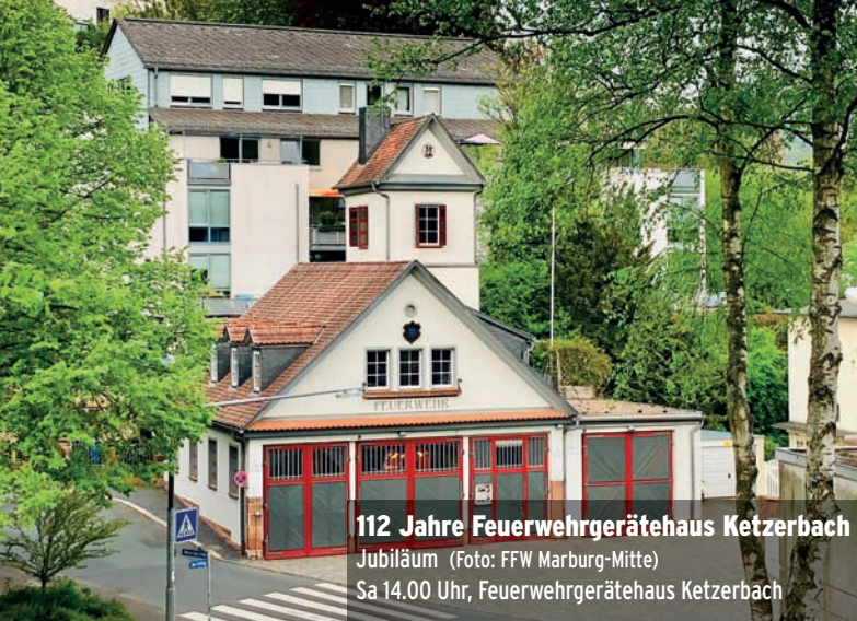
112 Jahre Feuerwehrgerätehaus Ketzertbach Jubiläum Sa 14.00 Uhr, Feuerwehrgerätehaus Ketzertbach

⊙21.30 Temporäre Spielstätte "ncetk Nø 4" des TNT, Augustinergasse 2