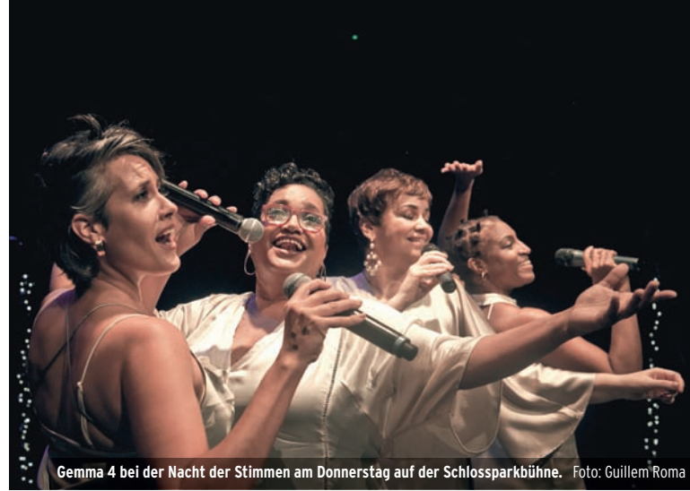
Gemma 4 bei der Nacht der Stimmen am Donnerstag auf der Schlossparkbühne.