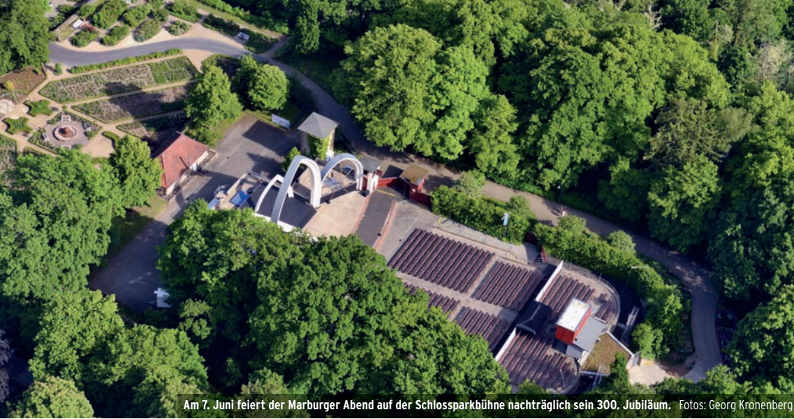
Am 7. Juni feiert der Marburger Abend auf der Schlossparkbühne nachträglich sein 300. Jubiläum.