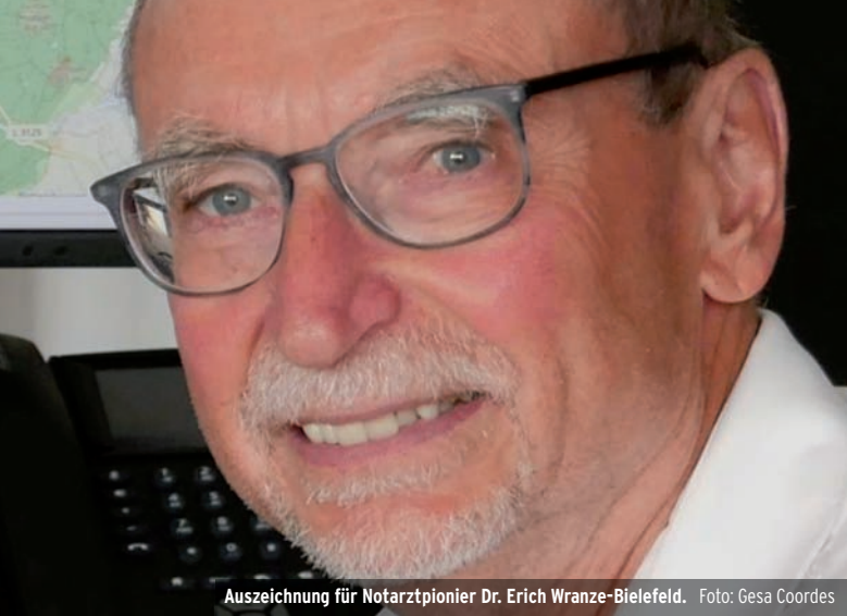
Auszeichnung für Notarztponier Dr. Erich Wranze-Bielefeld.