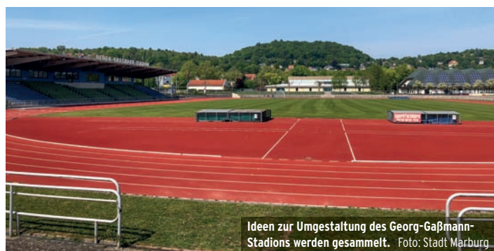
Ideen zur Umgestaltung des Georg-Gaßmann-Stadions werden gesammelt.

Infos: www.hausderjugend-marburg.de/marburger-zukunftspaket