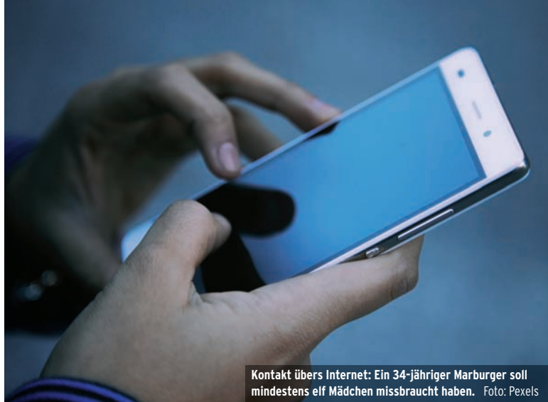
Kontakt übers Internet: Ein 34-jähriger Marburger soll mindestens elf Mädchen missbraucht haben.