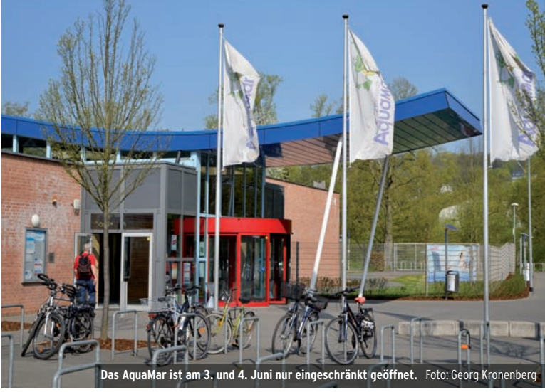
Das AquaMar ist am 3. und 4. Juni nur eingeschränkt geöffnet.

gesperrt. Die Sauna und das Freibad haben jedoch geöffnet. Am Sonntag, 4. Juni, findet der zweite Kinder- und Familientriathlon statt. Neben Radfahren und Laufen steht auch Schwimmen auf dem Programm, das im AquaMar stattfindet. Daher sind an diesem Tag bis etwa 14.30 Uhr nur das Aktionsbecken, das Kinderplanschbecken und die Rutsche für die Öffentlichkeit nutzbar. Die Sauna und das Freibad haben geöffnet. Eine Anmeldung für den Kinder- und Familientriathlon ist möglich unter fdb.ac/familientriathlon23 .