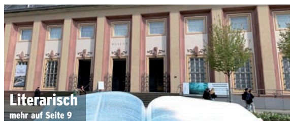
Literarisch mehr auf Seite 9