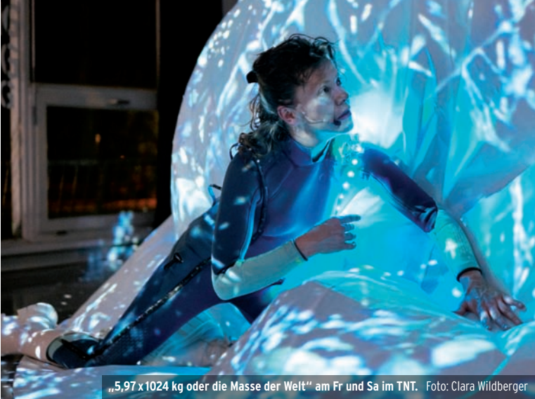
„5,97 x 1024 kg oder die Masse der Welt“ am Fr und Sa im TNT.