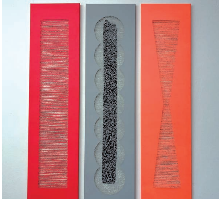
Leinwand-Cut-Outs von Silke Rath in der Galerie JPG.