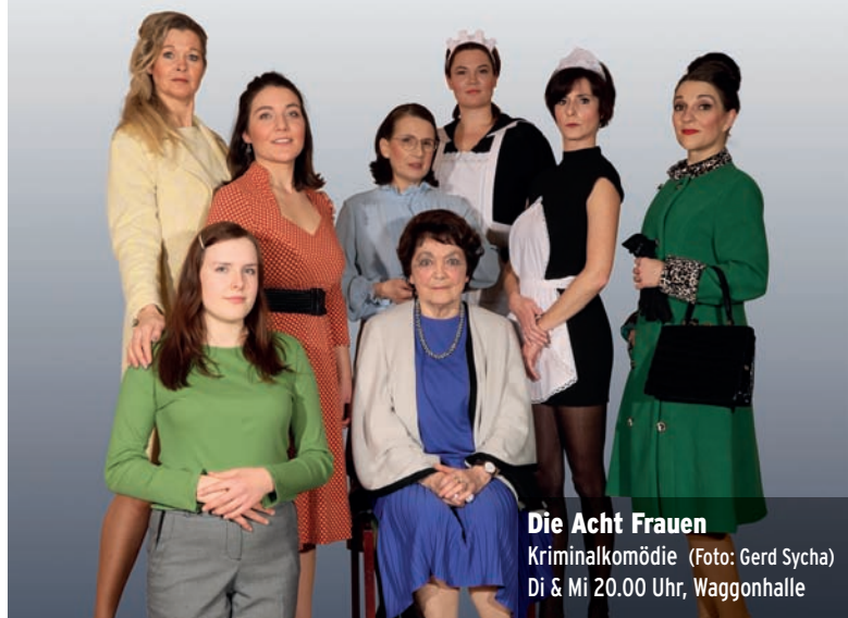
Die Acht Frauen Kriminalkomödie Di & Mi 20.00 Uhr, Waggonhalle