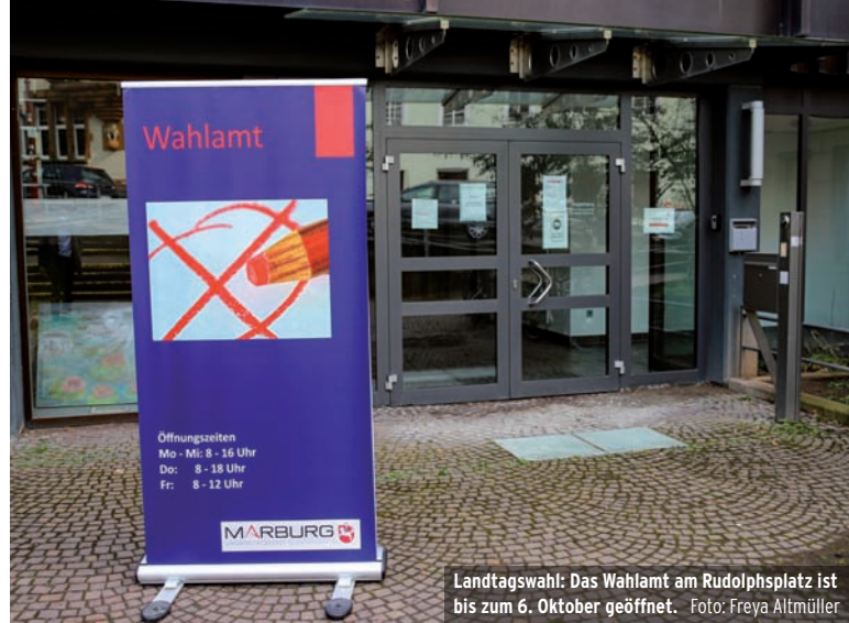
Landtagswahl: Das Wahlamt am Rudolphsplatz ist bis zum 6. Oktober geöffnet.