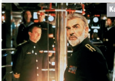
Kabel 1 - 20.15 Jagd auf Roter Oktober

Der Kalte Krieg ist vorbei, doch im Pentagon herrscht Alarmstufe Rot: Der russische Kapitän Marko Ramius steuert mit dem Atom-U-Boot „Roter Oktober“ die Ostküste der Vereinigten Staaten an. Will er angreifen, überlaufen oder Selbstmord begehen? CIA-Mann Jack Ryan soll eine Katastrophe verhindern...