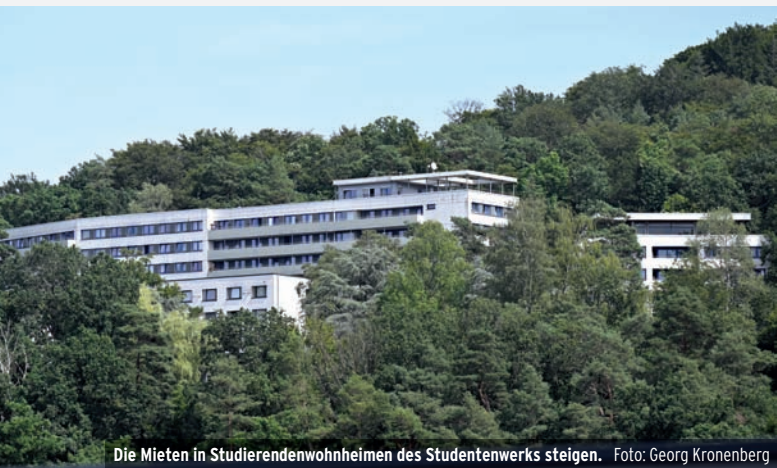
Die Mieten in Studierendenwohnheimen des Studentenwerks steigen.