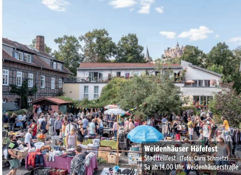
Weidenhäuser Höfefest Stadtteilfest Sa ab 14.00 Uhr, Weidenhäuserstraße