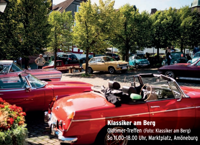
Klassiker am Berg Oldtimer-Treffen So 11.00–18.00 Uhr, Marktplatz, Amöneburg