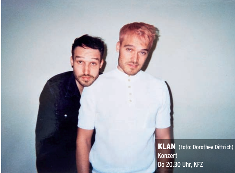
KLAN Konzert Do 20.30 Uhr, KFZ