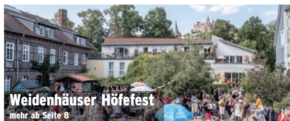
Weidenhäuser Höfefest mehr ab Seite 8