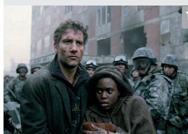
Tele 5 - 20.15 Children of Men

Im Jahr 2027 sind sämtliche Frauen unfruchtbar, was die Rentenkasse belastet. Die Menschheit steht vor dem Aussterben, und in einem chaotischen Großbritannien bittet Theos Ex Julian um Hilfe. Er soll die hochschwängere Afrikanerin Kee aus London in Sicherheit bringen.