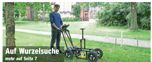
Auf Wurzelsuche mehr auf Seite 7