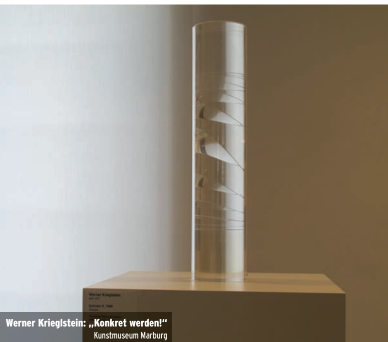
Werner Krieglstein: „Konkret werden!“ Kunstmuseum Marburg