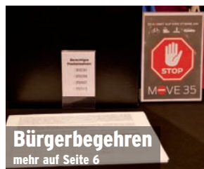
Bürgerbegehren mehr auf Seite 6