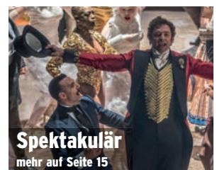
Spektakulär mehr auf Seite 15