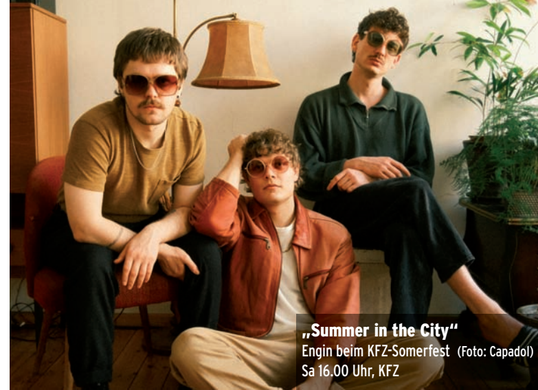
„Summer in the City“ Engin beim KFZ-Somerfest Sa 16.00 Uhr, KFZ