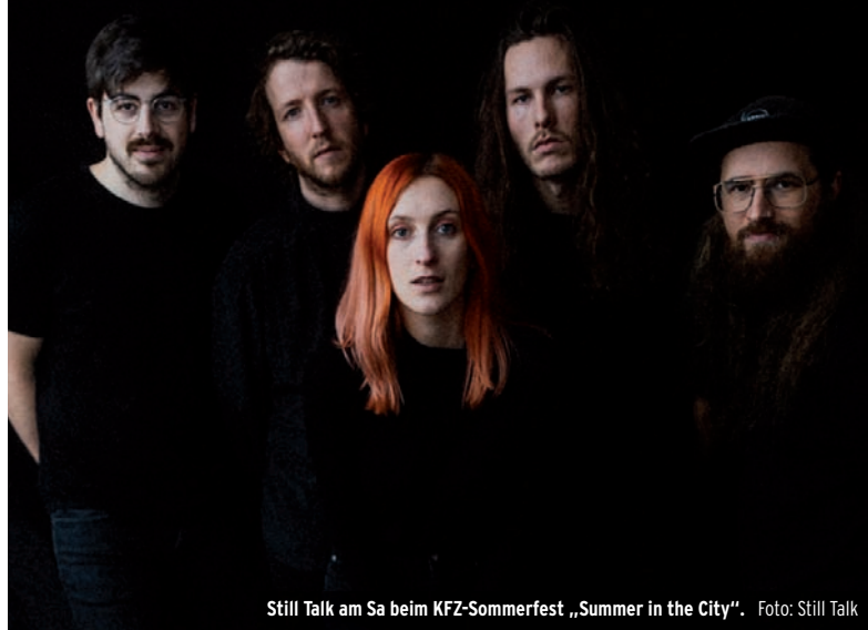
Still Talk am Sa beim KFZ-Sommerfest „Summer in the City“.

de aufgehört haben: mit schöner, schräger, schwungvoller Musik.