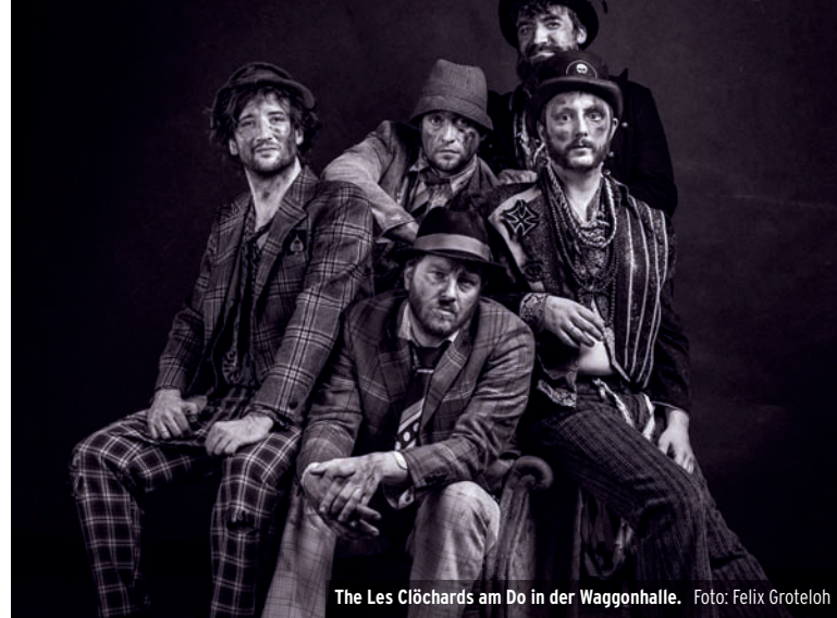
The Les Clöchards am Do in der Waggonhalle.