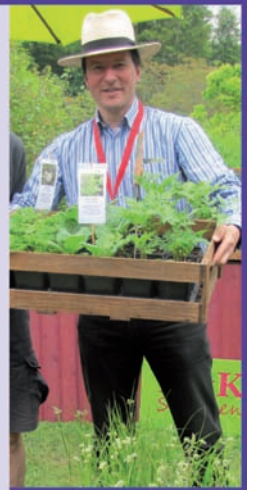
Schaugärten, Pflanzendoktor, Pflanzentaxi/-depot, Parkplätze