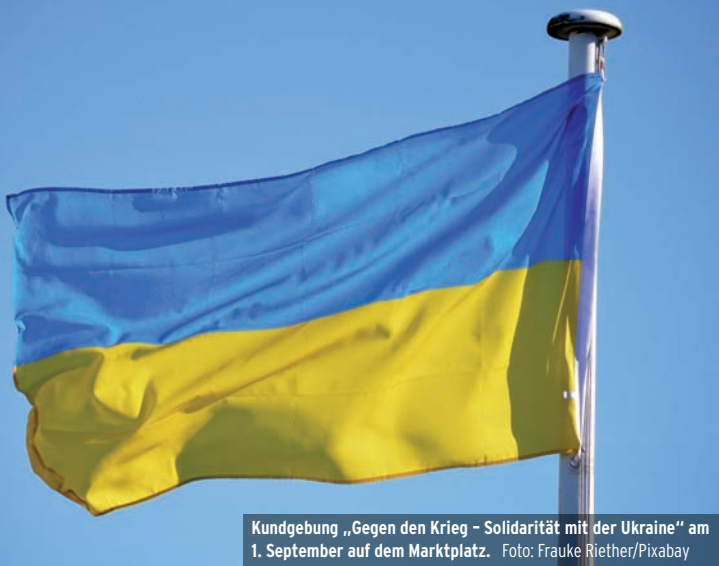
Kundgebung „Gegen den Krieg – Solidarität mit der Ukraine“ am 1. September auf dem Marktplatz.