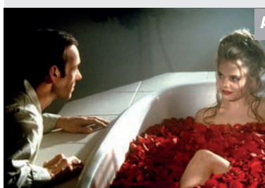
Arte - 20.15 American Beauty

Lester Burnham blickt aus dem Jenseits zurück auf sein Leben. Sein Job und seine Ehe langweilen ihn, seine Tochter hält ihn für einen Versager. Eine Schwärmerie für Janes Freundin Angela gibt ihm neue Hoffnung. Er kündigt seinen Job, beginnt zu kiffen und fantasieren über sie.