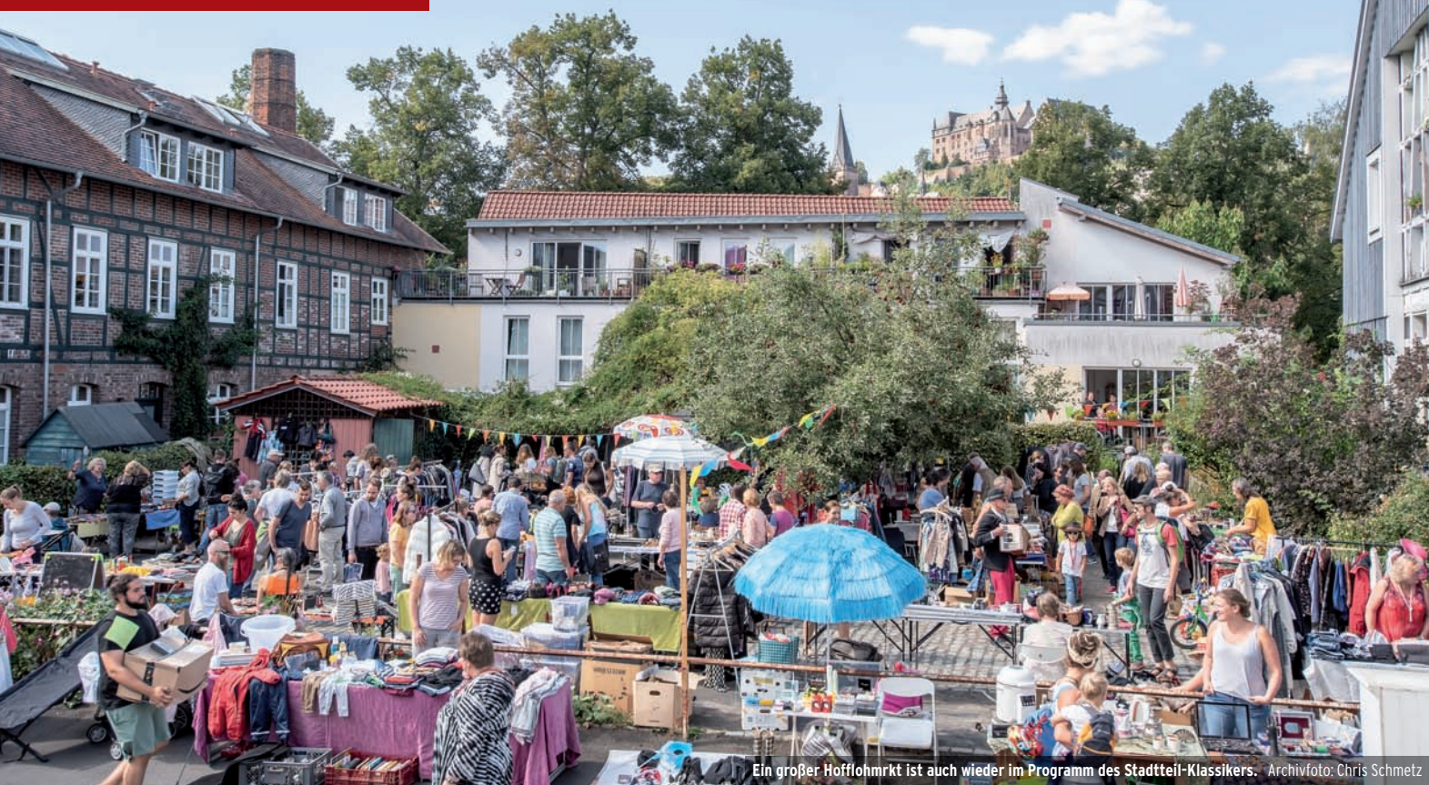
Ein großer Hofflohnmarkt ist auch wieder im Programm des Stadtteil-Klassikers.