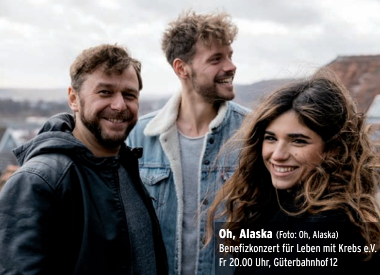
Oh, Alaska Benefizkonzert für Leben mit Krebs e.V. Fr 20.00 Uhr, Güterbahnhof 12