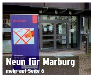
Neun für Marburg mehr auf Seite 6