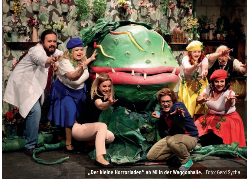
„Der kleine Horrorladen“ ab Mi in der Waggonhalle.