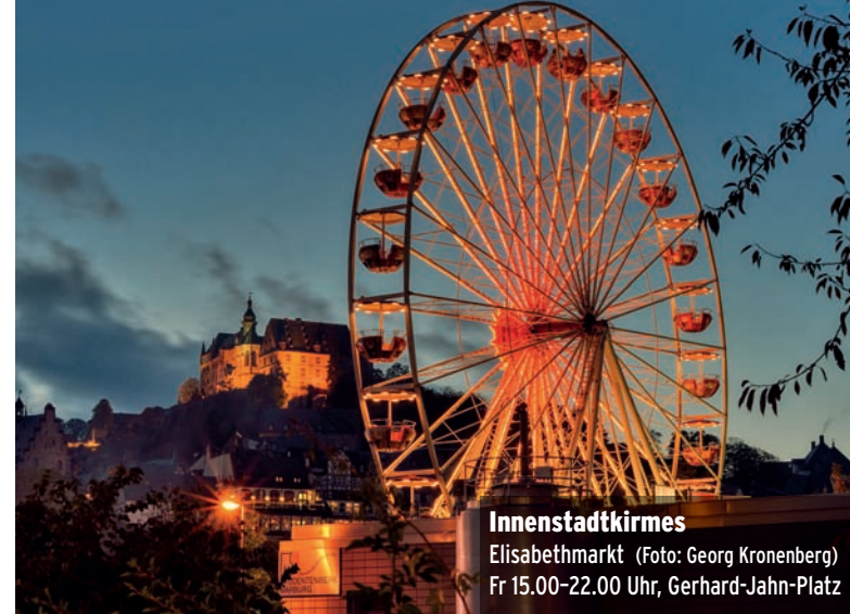
Innenstadtkirmes Elisabethmarkt Fr 15.00-22.00 Uhr, Gerhard-Jahn-Platz