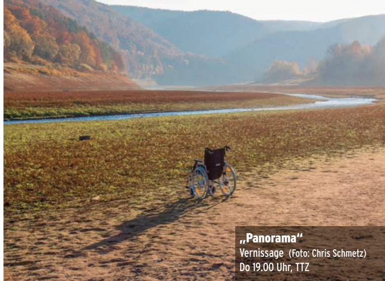
„Panorama“ Vernissage Do 19.00 Uhr, TTZ