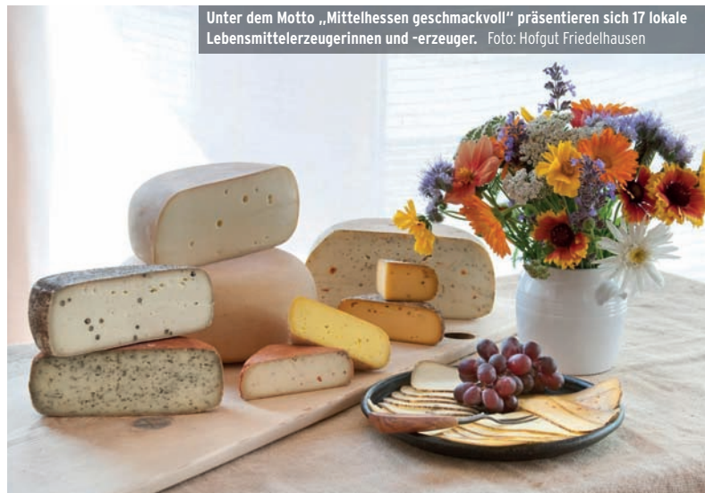
Unter dem Motto „Mittelhessen geschmackvoll“ präsentieren sich 17 lokale Lebensmittelherstellerinnen und -erzeuger.