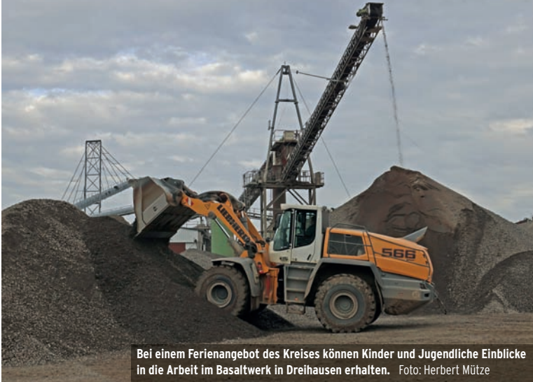
Bei einem Ferienangebot des Kreises können Kinder und Jugendliche Einblicke in die Arbeit im Basaltwerk in Dreihäusen erhalten.