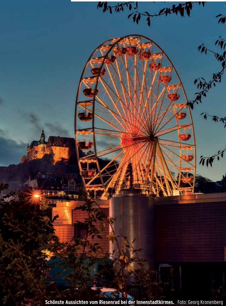
Schönste Aussichten vom Riesenrad bei der Innenstadtkirmes.

Marburger Elisabethmarkt am 7. und 8. Oktober