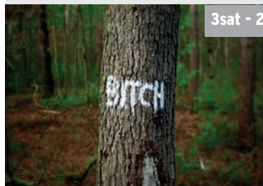
3sat - 20.15 Hass auf Frauen - Gewalt im Netz

Trotz #MeToo ist Frauenhass weit verbreitet, vor allem online. Das reicht von Belästigungen bis zu Todesdrohungen. Laut UN sind weltweit 73% der Frauen im Internet Hass ausgesetzt. Opfer leiden oft lebenslang unter den Folgen, während Täter oft straffrei bleiben. Vier Frauen teilen ihre Erfahrungen und ihr Leid.