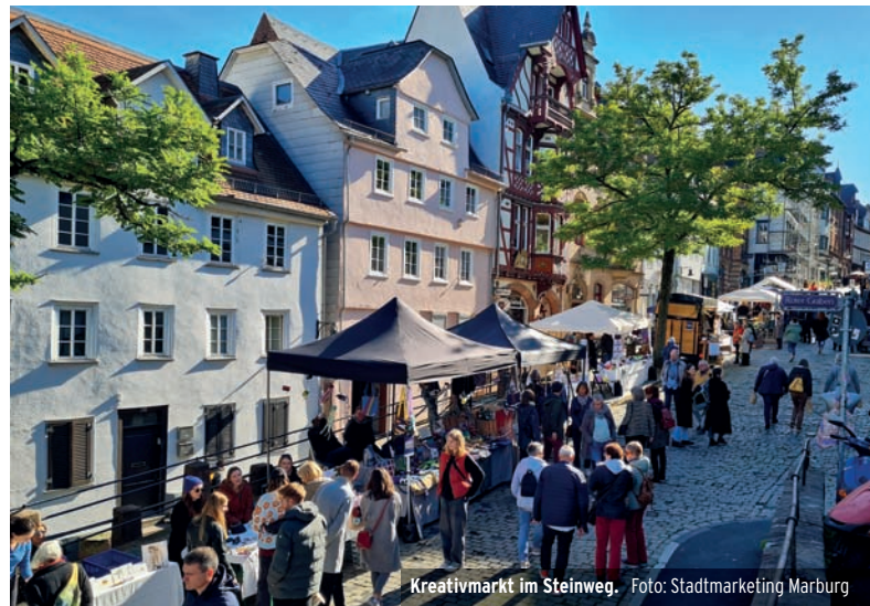
Kreativmarkt im Steinweg.

Sonntag, 8. Oktober, 12-18 Uhr in der Innenstadt