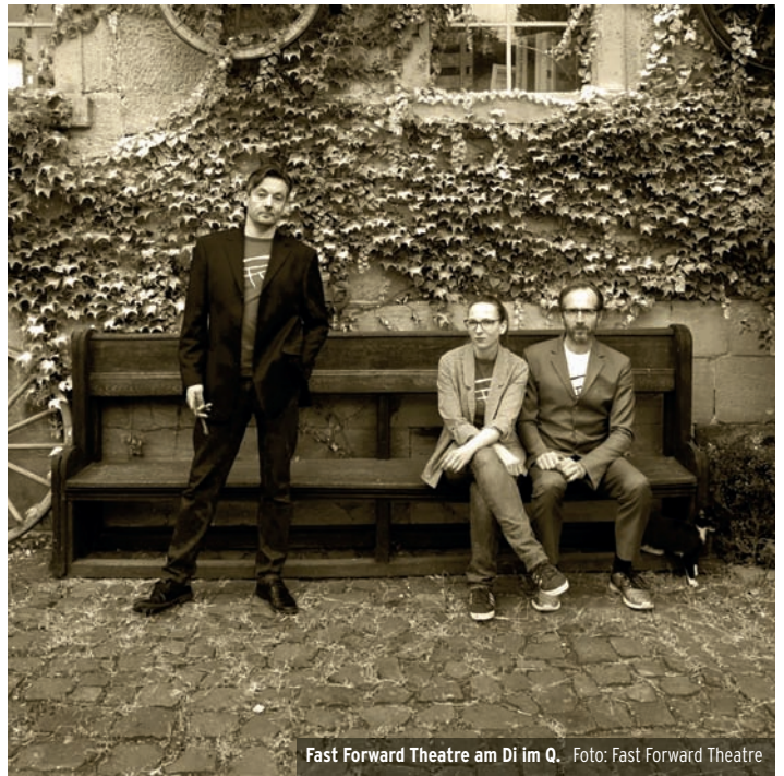
Fast Forward Theatre am Di im Q.