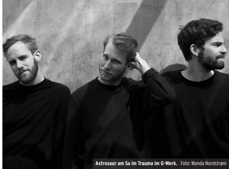
Astrosaur am Sa im Trauma im G-Werk.