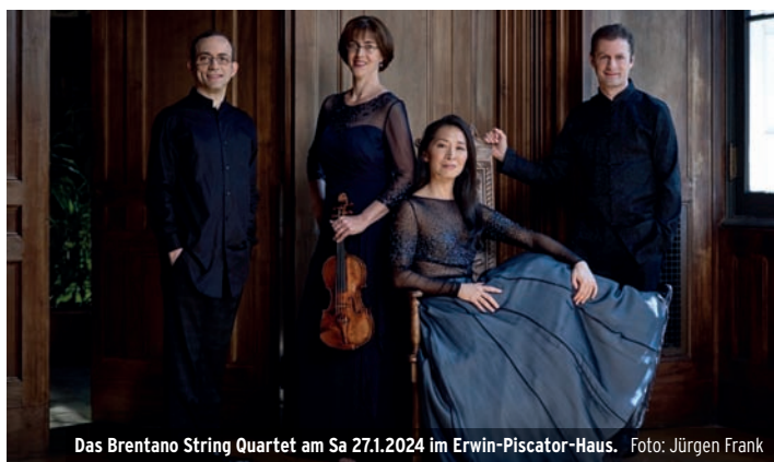
Das Brentano String Quartet am Sa 27.1.2024 im Erwin-Piscator-Haus.