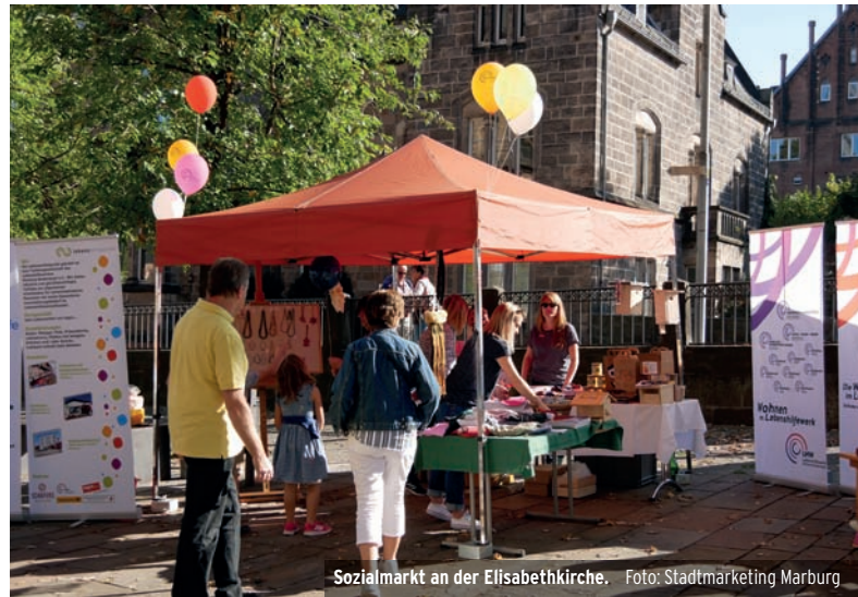
Sozialmarkt an der Elisabethkirche.