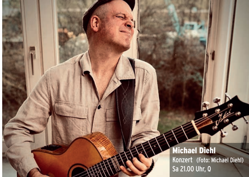
Michael Diehl Konzert Sa 21.00 Uhr, Q