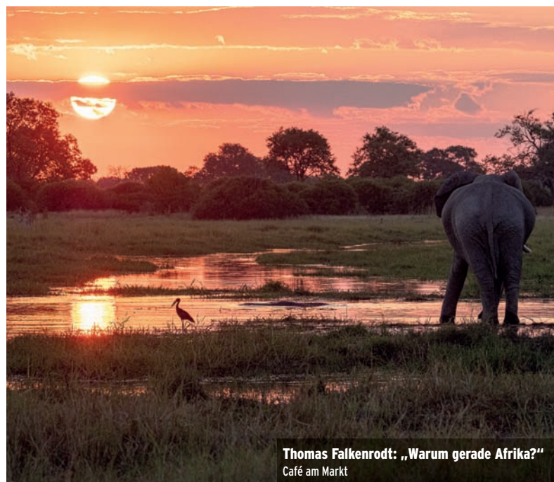
Thomas Falkenrodt: „Warum gerade Afrika?“ Café am Markt