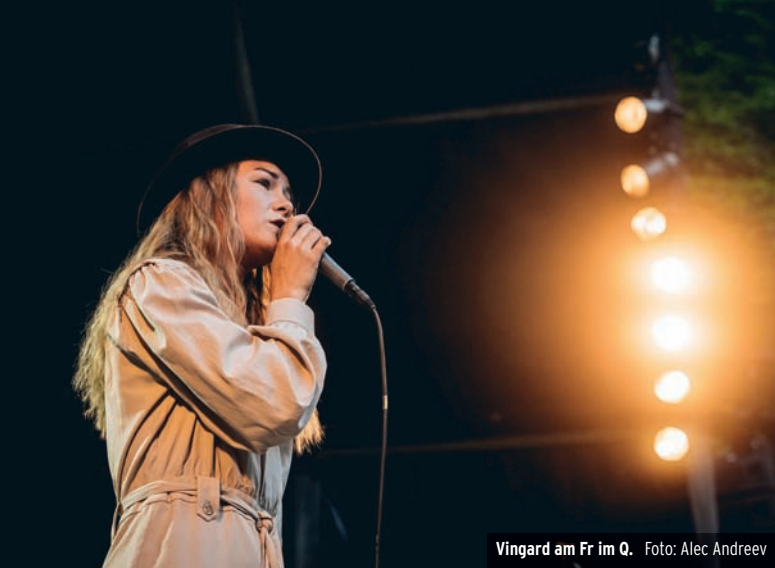
Vingard am Fr im Q.