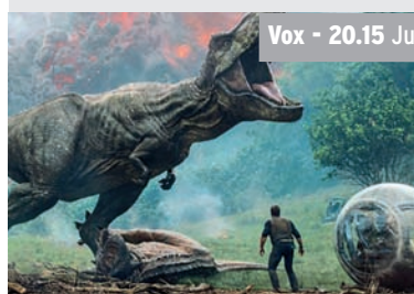
Vox - 20.15 Jurassic World: Das gefallene Königreich

Die letzten Dinosaurier sind vom Aussterben bedroht. Eine Rettungsaktion erweist sich als gefährlicher als gedacht.