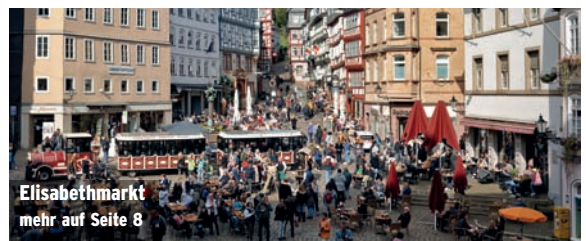
Elisabethmarkt mehr auf Seite 8