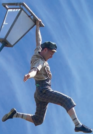
Kuriositätenjahrmarkt DrunkenMastEr zeigt akrobatische Show-Einlagen So 12.00-18.00 Uhr, Marktplatz