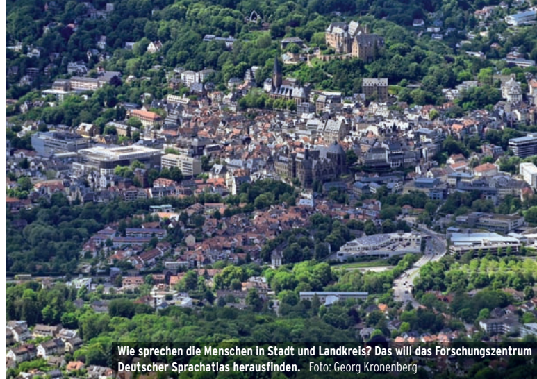
Wie sprechen die Menschen in Stadt und Landkreis? Das will das Forschungszentrum Deutscher Sprachatlas herausfinden.

kultur“ vor der Werkseinfahrt (Johannes Nickel Weg 2). Die Teilnahme ist kostenlos.