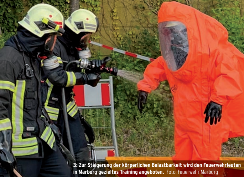
3: Zur Steigerung der körperlichen Belastbarkeit wird den Feuerwehrleuten in Marburg gezieltes Training angeboten.