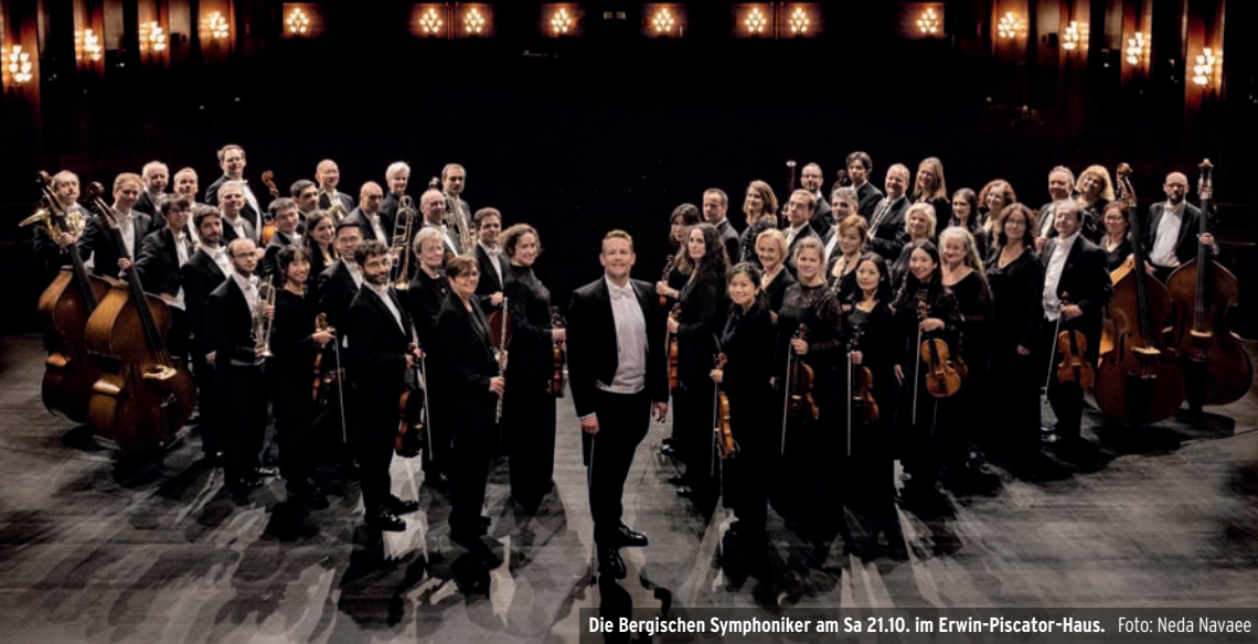
Die Bergischen Symphoniker am Sa 21.10. im Erwin-Piscator-Haus.