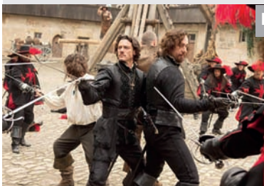
Kabel 1 - 22.00 Die drei Musketiere

Über Frankreich und England braut sich ein Krieg zusammen. Der junge D'Artagnan will nicht tatenlos zusehen und auf dem Land versauern, sondern reist voller Tatendrang nach Paris. Dort will er zu Athos, Aramis und Porthos stoßen. Doch die Musketiere prüfen ihn auf Herz und Nieren, bevor sie ihn in ihre Reihen aufnehmen.