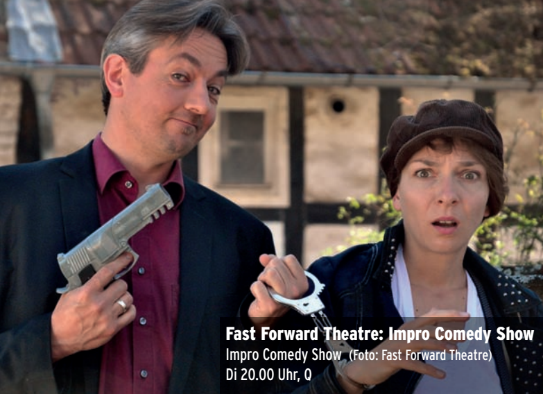
Fast Forward Theatre: Impro Comedy Show Impro Comedy Show Di 20.00 Uhr, 0