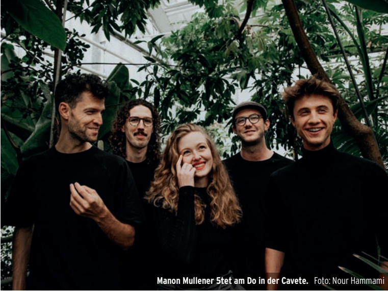
Manon Mullener 5tet am Do in der Cavete.