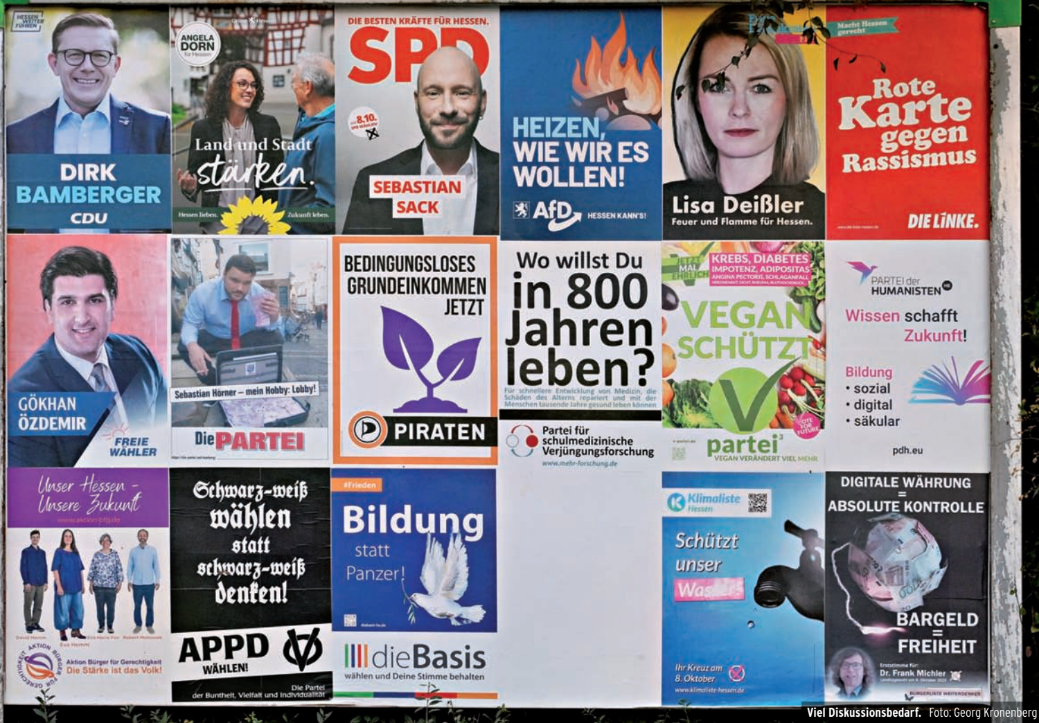
Viel Diskussionsbedarf.