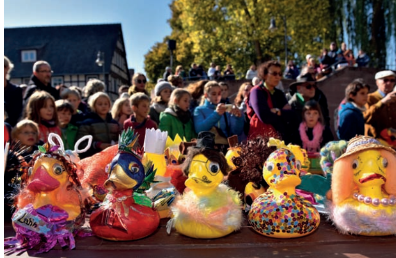
Die schnellsten und die schönsten Enten werden beim Entenrennen ausgezeichnet.