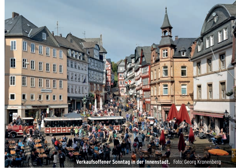
Verkaufsoffener Sonntag in der Innenstadt.

der lebenden Couch Platz, um sich darauf auszuruhen und sich zu unterhalten. Doch die Couch mischt sich ein, sie beginnt zu flüstern, lenkt das Gespräch und versucht herauszufinden, ob ihre Gäste in Übereinstimmung miteinander sind.