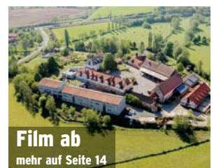
Film ab mehr auf Seite 14