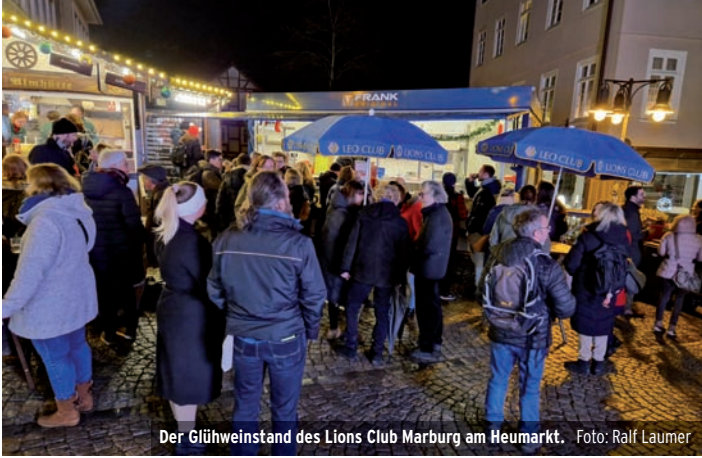
Der Glühweinstand des Lions Club Marburg am Heumarkt.