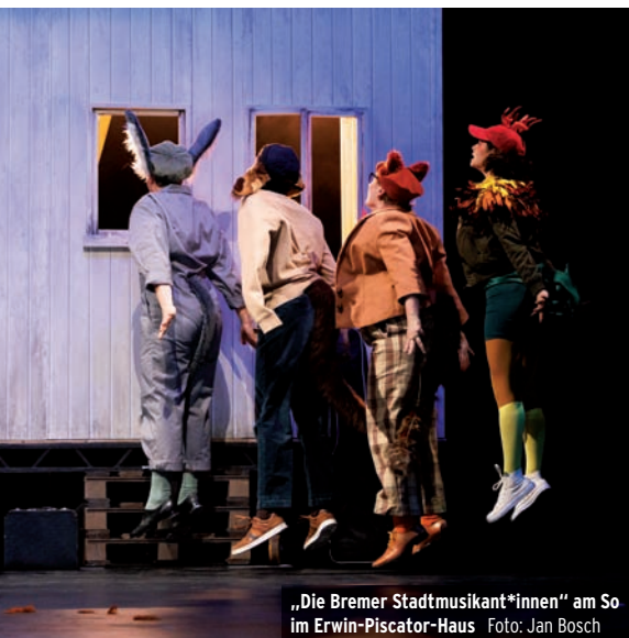
„Die Bremer Stadtmusikant*innen“ am So im Erwin-Piscator-Haus

Das Jugendensemble „Marburg&Music“ der Musikschule spielt ein winterliches Konzert-Programm im Rahmen von Marburg by Night. In der stimmungsvoll mit vielen Kerzen beleuchteten Elisabethkirche stehen das berühmte Violinkonzert „Der Winter“ von Antonio Vivaldi, eine Suite für Violine und Viola des schwedischen Komponisten Kurt Atterberg sowie die St.