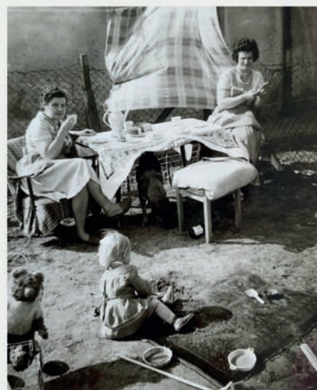
MARBURGER STADTSCHRIFTEN ZUR GESCHICHTE UND KULTUR