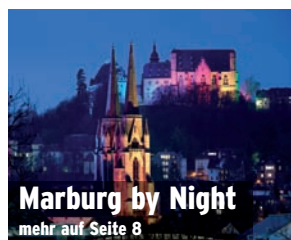
Marburg by Night mehr auf Seite 8