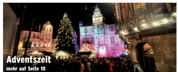
Adventszeit mehr auf Seite 10