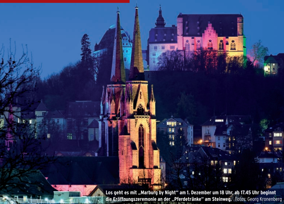
Los geht es mit „Marburg by Night“ am 1. Dezember um 18 Uhr, ab 17.45 Uhr beginnt die Eröffnungszereemonie an der „Pferdetränke“ am Steinweg.