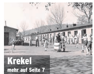
Krekel mehr auf Seite 7