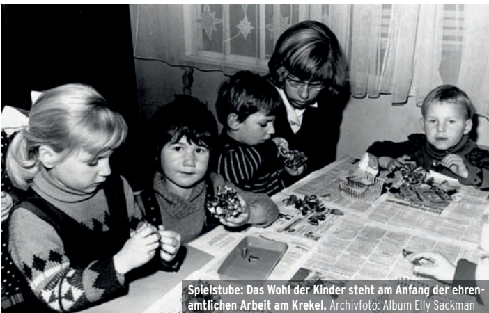
Spielstube: Das Wohl der Kinder steht am Anfang der ehrenamtlichen Arbeit am Krekel.