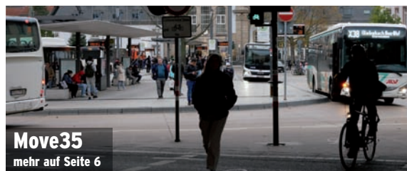
Move35 mehr auf Seite 6