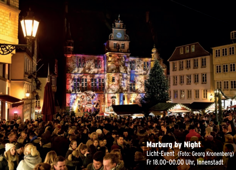
Marburg by Night Licht-Event Fr 18.00-00.00 Uhr, Innenstadt