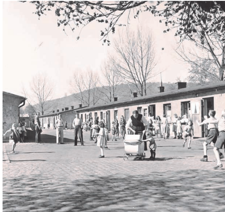
Viele Familien lebten über Generationen in der Siedlung am Krekel in Marburg.

Erzählt wird in über 20 Kapiteln in dem Buch von den Schwierigkeiten und Herausforderungen eines Lebens, das Familien und den Einzelnen oft auf engstem Raum und mit Wasser nur auf dem Hof sehr viel abverlangte – aber auch von Kindheit und Alltag, von der Verfolgung durch die Nationalsozialisten und vom Zusammenhalt sowie vom Beginn jener Gemeinwesen- und Stadtteilsozialarbeit, die Marburg bis heute stark mache, informiert Stadtschriftenleiterin Sabine Preisler.