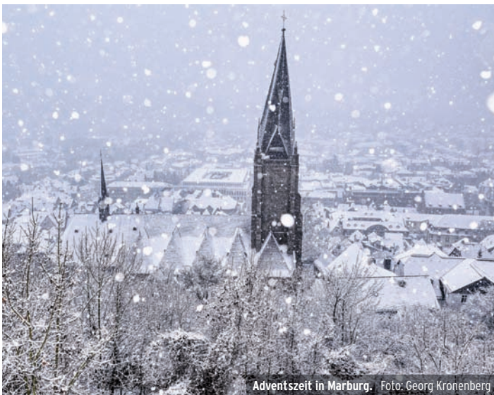
Adventszeit in Marburg.