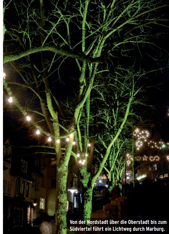
Von der Nordstadt über die Oberstadt bis zum Südviertel führt ein Lichtweg durch Marburg.