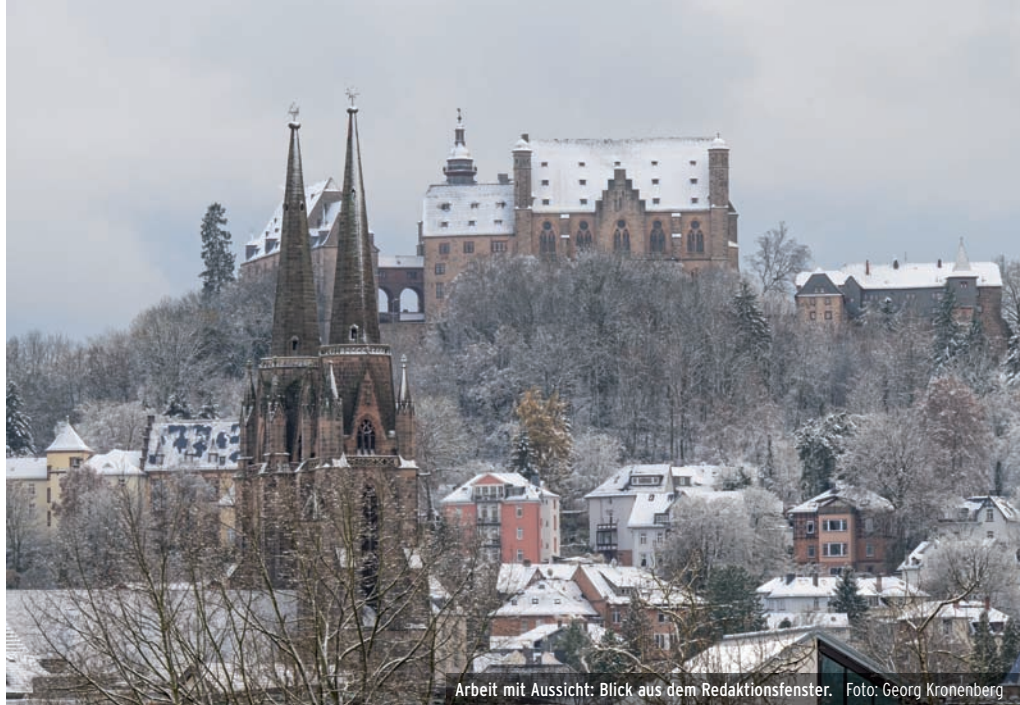
Arbeit mit Aussicht: Blick aus dem Redaktionsfenster.

Titelbild: Die Bremer Stadtmusikant*innen