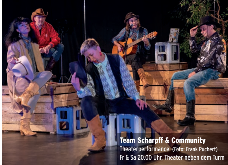
Team Scharpff & Community Theaterperformance Fr & Sa 20.00 Uhr, Theater neben dem Turm