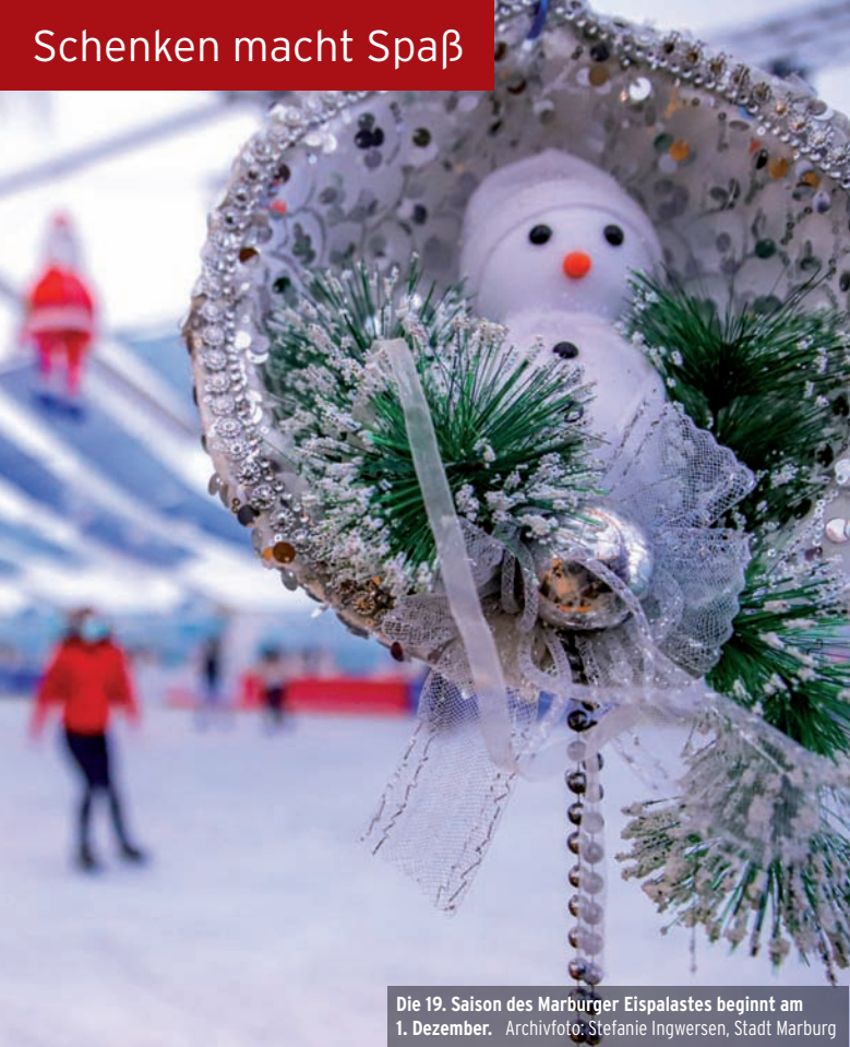
Die 19. Saison des Marburger Eispalastes beginnt am 1. Dezember.