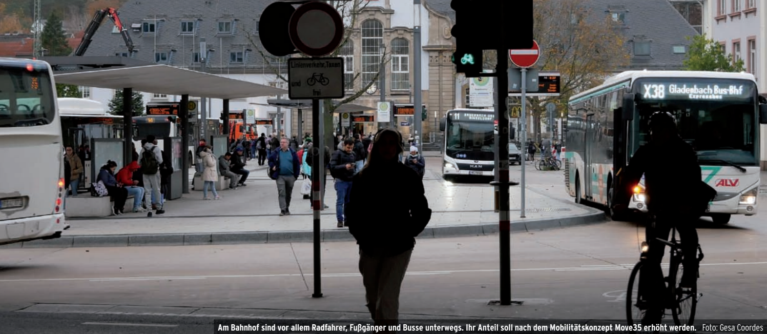
Am Bahnhof sind vor allem Radfahrer, Fußgänger und Busse unterwegs. Ihr Anteil soll nach dem Mobilitätskonzept Move35 erhöht werden.