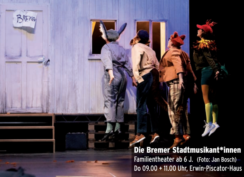
Die Bremer Stadtmusikant*innen Familientheater ab 6 J. – Do 09.00 + 11.00 Uhr, Erwin-Piscator-Haus