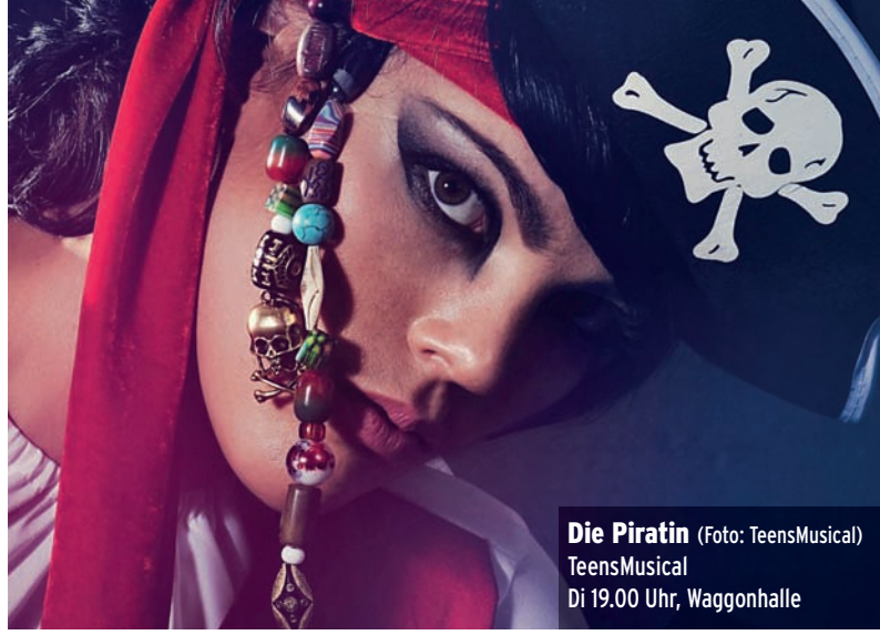
Die Piratin TeensMusical Di 19.00 Uhr, Waggonhalle

Folge uns auf Instagram! @expressmarburg