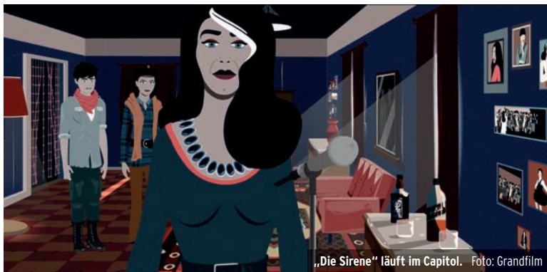
„Die Sirene“ läuft im Capitol.

von einer kosmischen Kraft erhört wird - einem kleinen Ball mit grenzenloser Energie namens Stern. Gemeinsam stellen sich Asha und Stern einem schrecklichen Gegner - dem Herrscher von Rosas, König Magnifico - um ihre Gemeinschaft zu retten und zu beweisen, dass wunderbare Dinge geschehen können, wenn sich der Wille eines mutigen Menschen mit der Magie der Sterne verbindet.