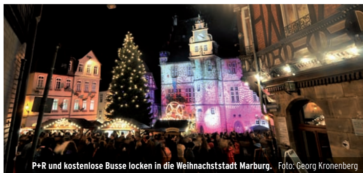
P+R und kostenlose Busse locken in die Weihnachtstadt Marburg.