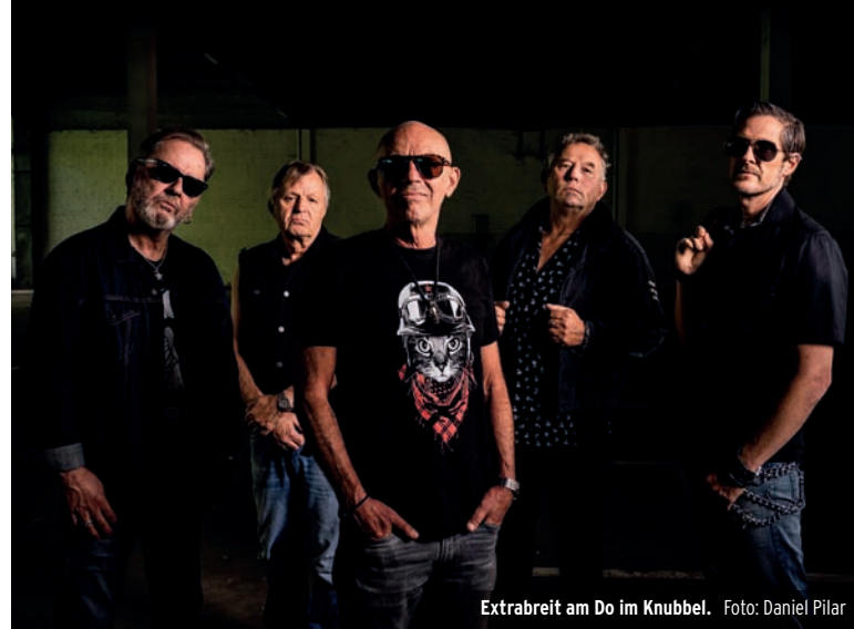
Extrabreit am Do im Knubbel.