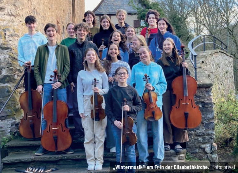
„Wintermusik“ am Fr in der Elisabethkirche.