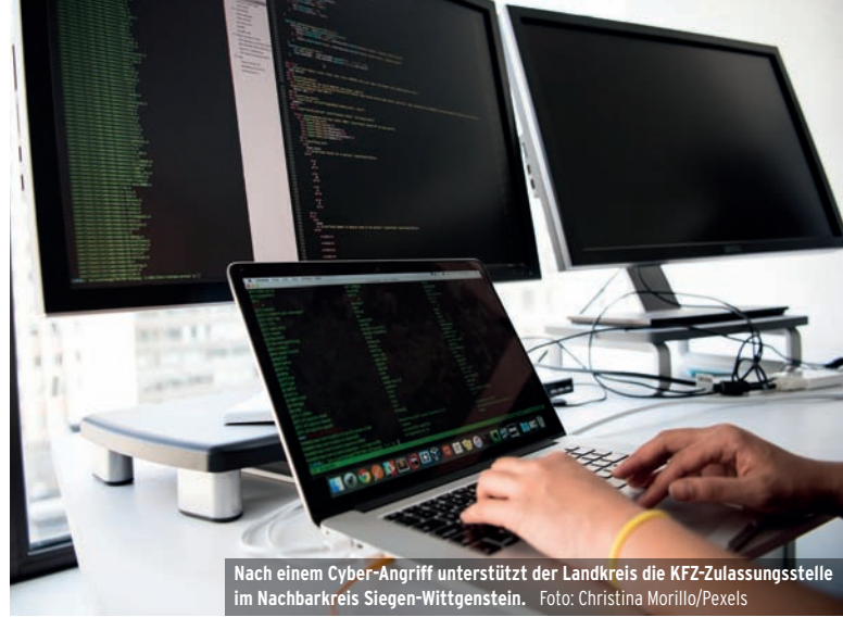
Nach einem Cyber-Angriff unterstützt der Landkreis die KFZ-Zulassungsstelle im Nachbarkreis Siegen-Wittgenstein.