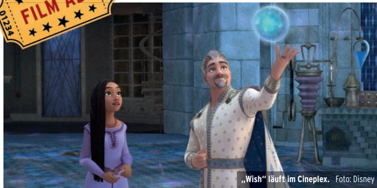
„Wish“ läuft im Cineplex.