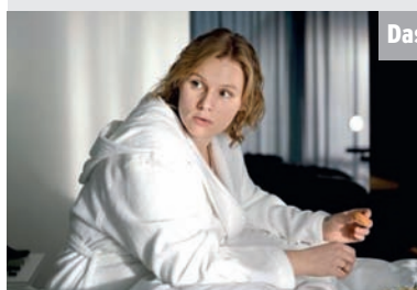
Das Erste - 20.15 Jackpot

Maren arbeitet bei einem Ab- schleppunternehmen. Als sie in einem Wagen eine Tasche mit über 600.000 Euro findet, wird sie auf eine harte Probe gestellt. Der plötz- liche Geldsegen könnte für Maren und ihren Mann eine Perspektive be- deuten.