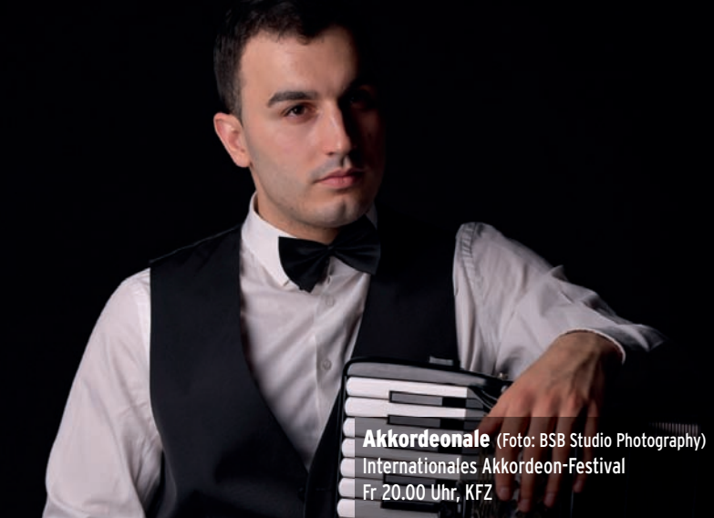
Akkordeonale Internationales Akkordeon-Festival Fr 20.00 Uhr, KFZ