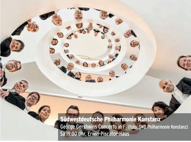
Südwestdeutsche Philharmonie Konstanz George Gershwins Concerto in F Sa 19.00 Uhr, Erwin-Piscator-Haus