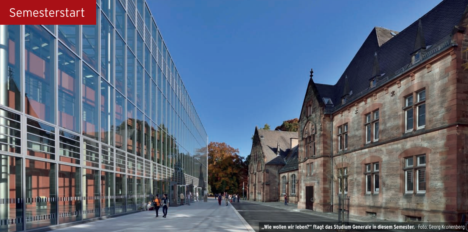
„Wie wollen wir leben?“ ftagt das Studium Generale in diesem Semester.