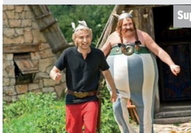
Super RTL - 20.15 Asterix & Obelix

Im Auftrag Ihrer Majestät. Römer auf den britischen Inseln? Das fehlte gerade noch! Vom englischen Hof eilt der Bote Teefax nach Gallien, um Verstärkung anzufordern. Asterix und Obelix sind gleich zur Stelle, als es darum geht, die römischen Heere aus Britannien fernzuhalten.