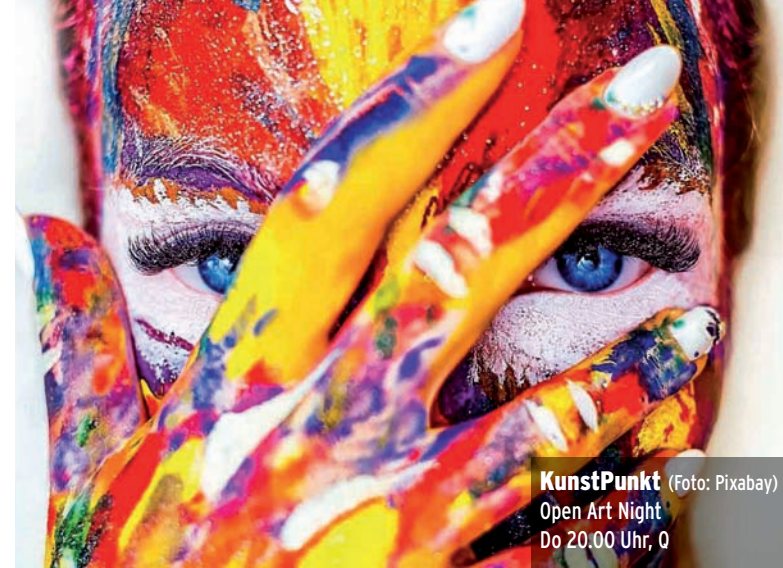
KunstPunkt Open Art Night Do 20.00 Uhr, 0