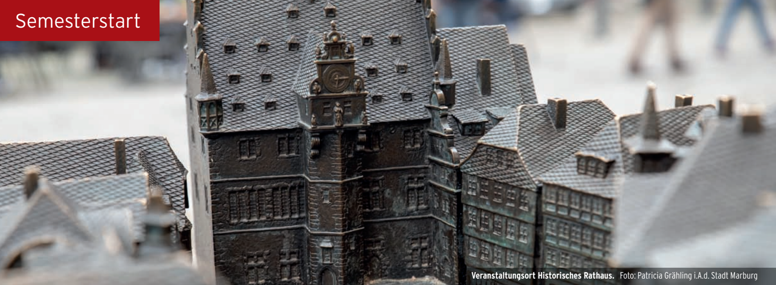
Veranstaltungsort Historisches Rathaus.