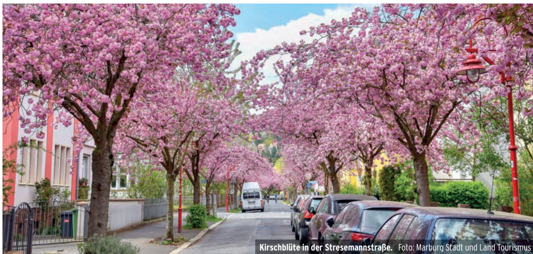
Kirschblüte in der Stresemannstraße.