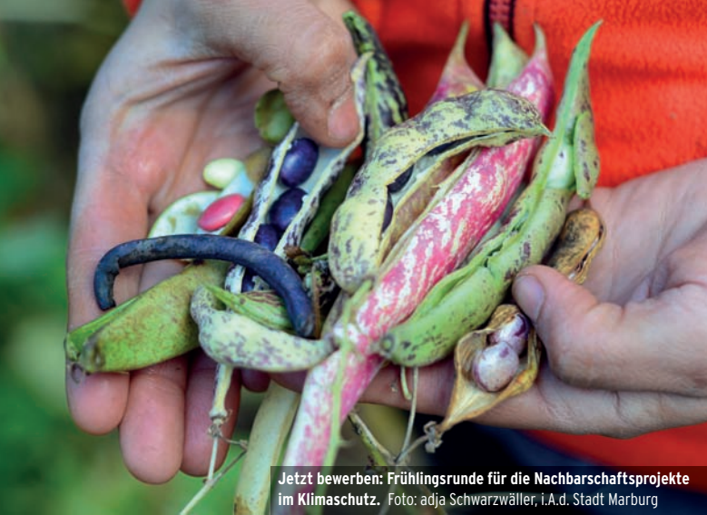
Jetzt bewerben: Frühlingsrunde für die Nachbarschaftsprojekte im Klimaschutz.