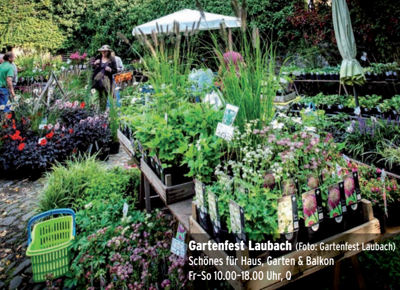
Gartenfest Laubach Schönes für Haus, Garten & Balkon Fr-So 10.00-18.00 Uhr, Q