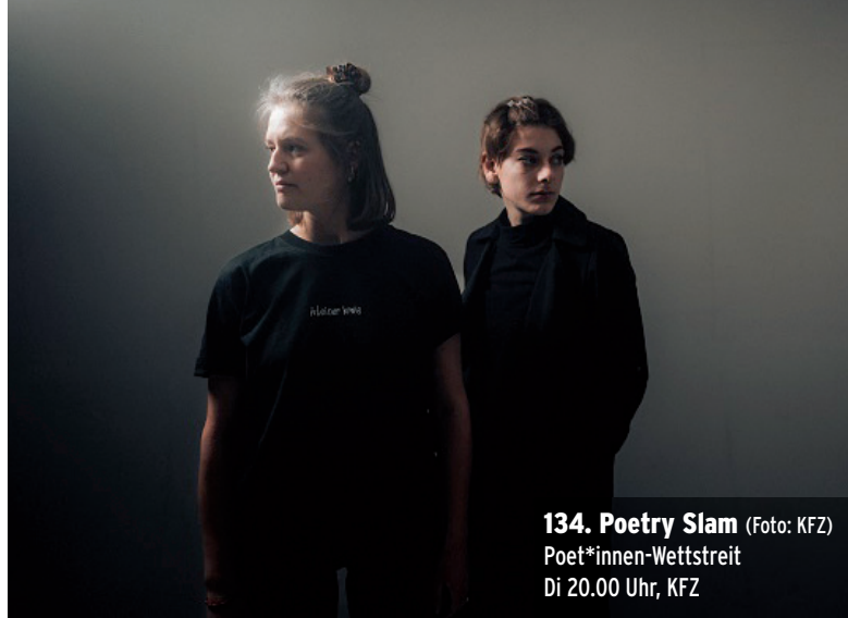
134. Poetry Slam Poet*innen-Wettstreit Di 20.00 Uhr, KFZ

Tanz und Neugier darauf, was die Tänze in dir wecken. ©12.00-14.00 Paul Gerhardt Haus, Zur Aue 2