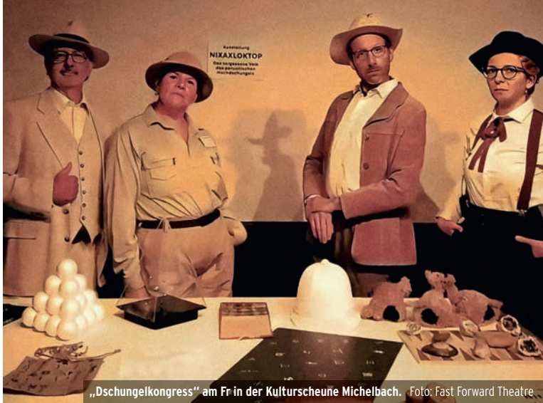
„Dschungelkongress“ am Fr in der Kulturscheune Michelbach.