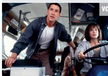
VOX - 22.30 Speed

Ein Terrorist hat eine Bombe in einem Bus installiert. Wenn der Bus eine bestimmte Geschwindigkeit un- terschreitet, explodiert er. Während Jack Traven von der Antiterrorrein- heit versucht, in den durch L.A. ra- senden Bus zu steigen, wird der Busfahrer verletzt.