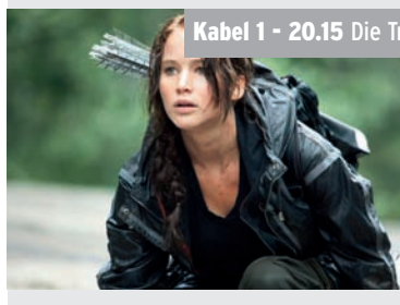
Kabel 1 - 20.15 Die Tribute von Panem - The Hunger Games

Im autokratisch regierten Panem laufen die Vorbereitungen für eine blutrünstige Tradition auf Hochtouren: Wie in jedem Jahr müssen in dem in zwölf Distrikte unterteilten Staat jeweils zwei Teenager bei den sogenannten Hungerspielen, einem Wettstreit auf Leben und Tod, antreten.