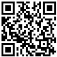
QR-Code zum Imagevideo