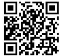
QR-Code zur Infoseite