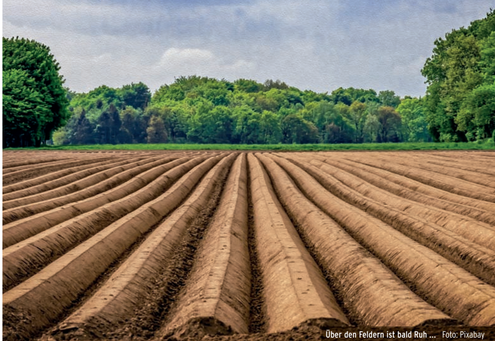
Über den Feldern ist bald Ruh ...

Titelbild: Löwenzahn und Bienen