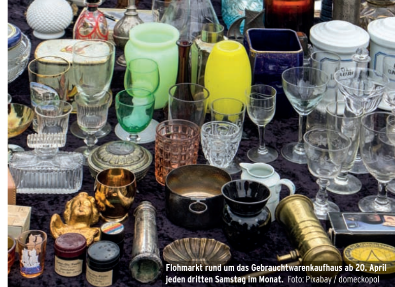
Flohmarkt rund um das Gebrauchtwarenkaufhaus ab 20. April jeden dritten Samstag im Monat.