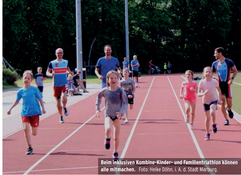
Beim inklusiven Kombi-Kinder- und Familientriathlon können alle mitmachen.

Die Disziplin Schwimmen findet im AquaMar statt, die Disziplinen Radfahren und Laufen in und um das Universitätsstadion. Wer dann