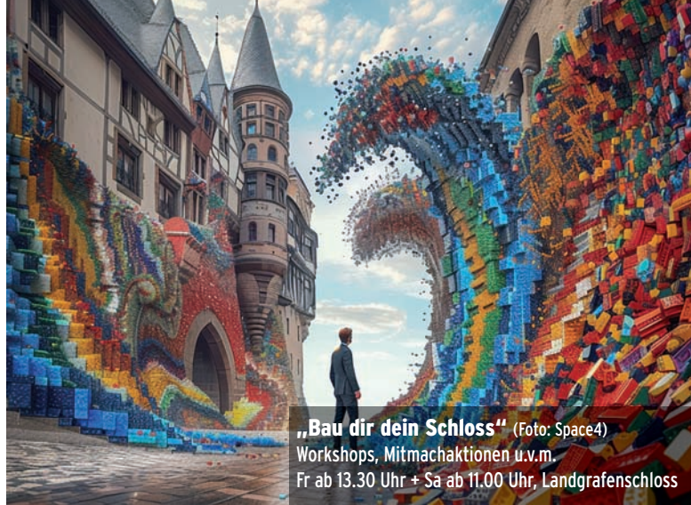
„Bau dir dein Schloss“ Workshops, Mitmachaktionen u.v.m. Fr ab 13.30 Uhr + Sa ab 11.00 Uhr, Landgrafenschloss