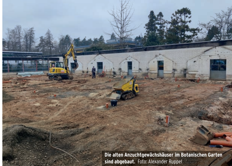
Die alten Anzuchtgewächshäuser im Botanischen Garten sind abgebaut.

lassen sich bequem mit dem Rad erledigen. Das schont die Umwelt und fördert zudem die Gesundheit. Im vergangenen Jahr nahmen 1.727 Radelnde aus dem Landkreis an der Kampagne teil. Insgesamt legten diese 388.000 Kilometer zurück und radelten damit umgerechnet fast zehn Mal um die Welt.