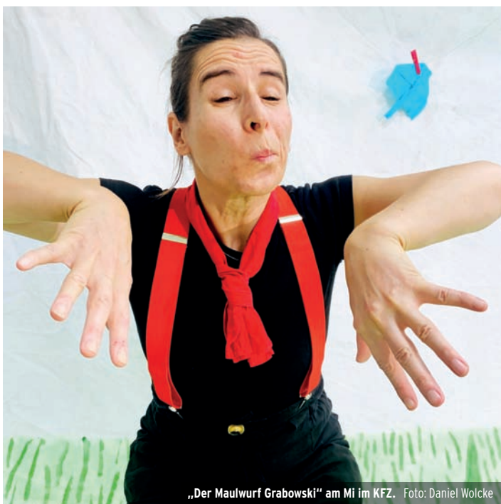
„Der Maulwurf Grabowski“ am Mi im KFZ.

Kilkelly kombiniert Folk-Balladen mit jazz- und blueslastigen Gitarrenpassagen und unterhält sein Publikum mit lustigen und absurden Anekdoten. Die Songs des Künstlers, die den musikalischen Genremix zu einer Einheit verbinden, sprechen dagegen neben Alltagsgeschichten auch die harten Wahrheiten des Lebens an: erzählerische, charakterstarke Texte, voll von Sehnsucht, Bedenken und unglücklichen Aussteigern - fest am Firmament der irischen Folktradition.