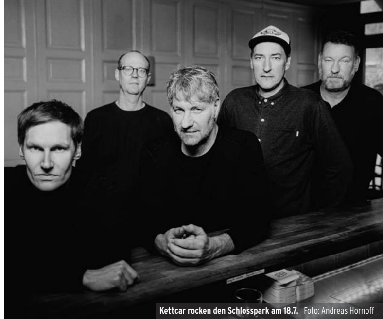
Kettcar rocken den Schlosspark am 18.7.