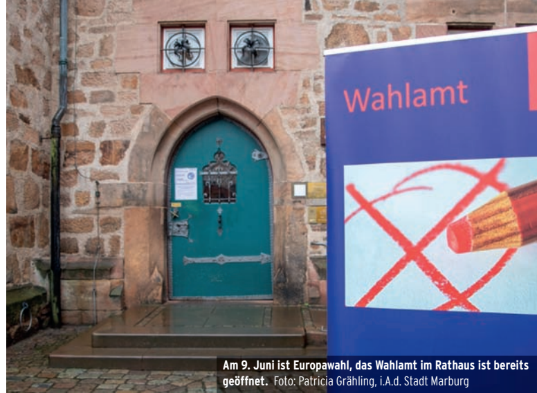
Am 9. Juni ist Europawahl, das Wahlamt im Rathaus ist bereits geöffnet.