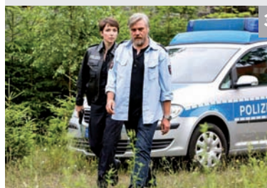
3sat - 20.15 Harter Brocken

Dass es in der beschaulichen Harzbank von Sankt Andreasberg nicht viel zu holen gibt, weiß Polizist Frank Koops aus eigener Erfahrung: Ihm wurde gerade ein Kredit verweigert. Diese Filiale will Simone Schmidt mit ihren beiden Komplizen ausräumen.