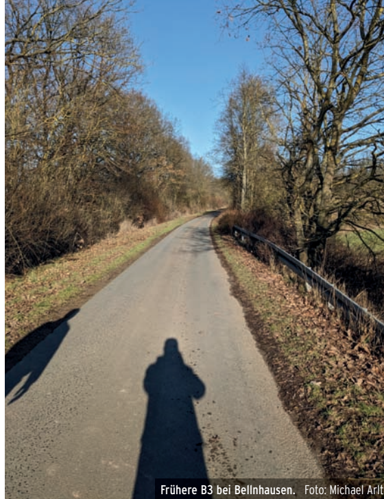
Frühere B3 bei Bellnhausen.