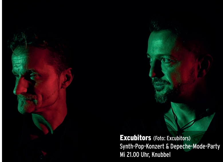
Excubitors Synth-Pop-Konzert & Depeche-Mode-Party Mi 21.00 Uhr, Knubbel

Anmeldung nicht erforderlich. Infos: marburg.de/gesundestadt ⊙18.00-18.30 Auf der Weide, Auf der Weide