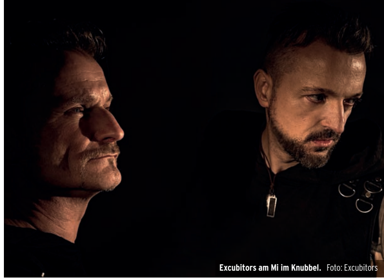
Excubitors am Mi im Knubbel.

Kinderwunsch unerfüllt. Deborahs Projekt, der Welt gute Nachrichten zu erzählen, zwingt sie schmerzlich oft, ein Auge zuzudrücken. Winnie verwickelt Una in ihre Suche nach dem verschollenen Ehemann, und zwei Personen, die bisher einen weiten Bogen umeinander gemacht haben, finden eine Schnittmenge. Maja möchte viel lieber eine Hochzeit des englischen Königshauses besuchen, als sich mit ihrer bevorstehenden Geburt zu beschäftigen. Und dann ist da noch Frank Sinatra, der Menschen auf der Straße Geschichten der Weltliteratur für nur wenige Cents erzählt. Als er auf die Literaturwissenschaftlerin Leila trifft, scheint sich endlich ein Gespräch unter Gleichgesinnten zu entspinnen.