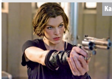
Kabel 1 - 22.50 Resident Evil: Afterlife

Als Versuchskaninchen für Genversuche ist Alice vor dem T-Virus sicher, doch um sie herum verwandeln sich immer mehr Erkrankte dadurch in Zombies. Sie lässt sie nichts unversucht, um die Pharmafirma zur Verantwortung zu ziehen, die für die Epidemie verantwortlich ist.