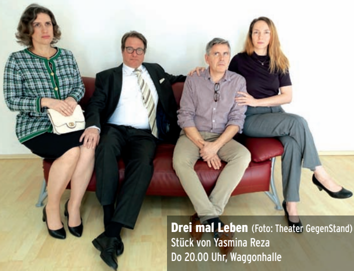
Drei mal Leben Stück von Yasmina Reza Do 20.00 Uhr, Waggonhalle