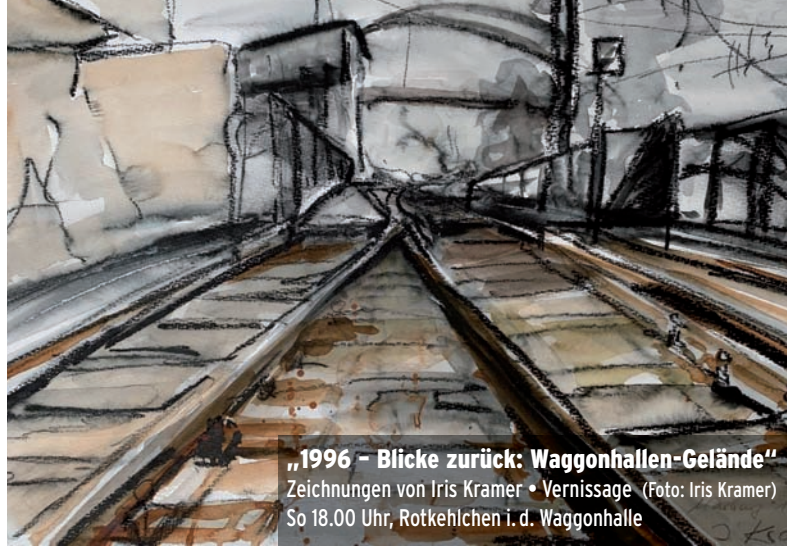
„1996 – Blicke zurück: Waggonhallen-Gelände“ Zeichnungen von Iris Kramer • Vernissage So 18.00 Uhr, Rotkehlchen i. d. Waggonhalle

Fragmente II: Entfremdung Brecht mit der Gewohnheit, irritiert euch selbst und erfahrt mit ihnen Höhen und Tiefen eines zentralen Zustands des menschlichen Wesens: Entfremdung. ⊙17.00-20.00 Atelier Studio 42, Ketzlerbach 42