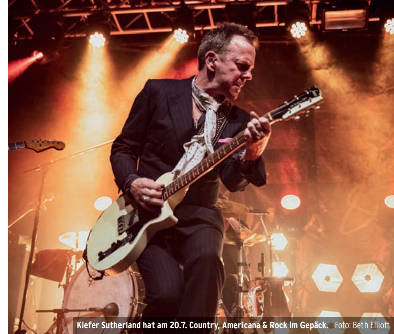
Kiefer Sutherland hat am 20.7. Country, Americana & Rock im Gepäck.