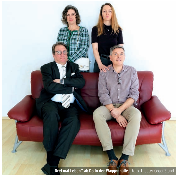
„Drei mal Leben“ ab Do in der Waggonhalle.