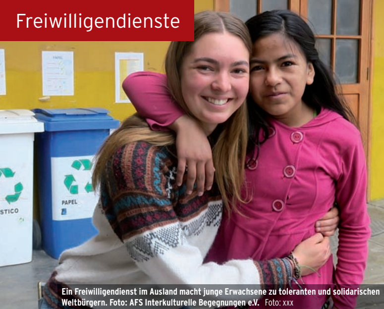
Ein Freiwilligendienst im Ausland macht junge Erwachsene zu toleranten und solidarischen Weltbürgern.