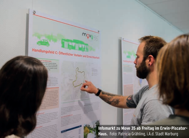
Infomarkt zu Move 35 ab Freitag im Erwin-Piscator-Haus.