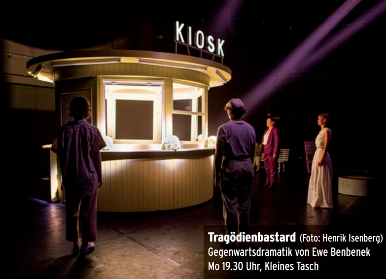
Tragödienbastard Gegenwartsdramatik von Ewe Benbenek Mo 19.30 Uhr, Kleines Tasch