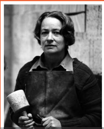
Hanna Korflür. Segel, die den Aufbruch markieren Vorstellung der neuen Stadtschrift Fr 15.00 Uhr, Historischer Rathaussaal