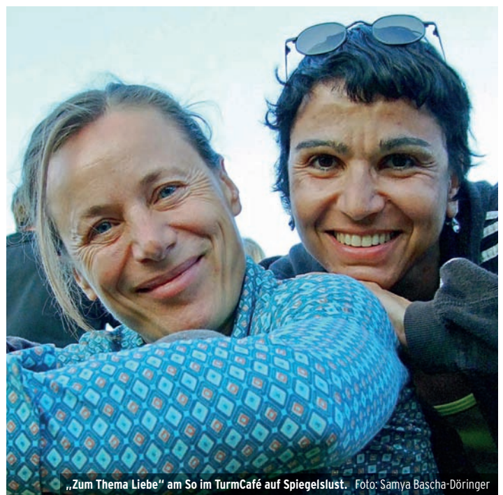
„Zum Thema Liebe“ am So im TurmCafé auf Spiegellust.