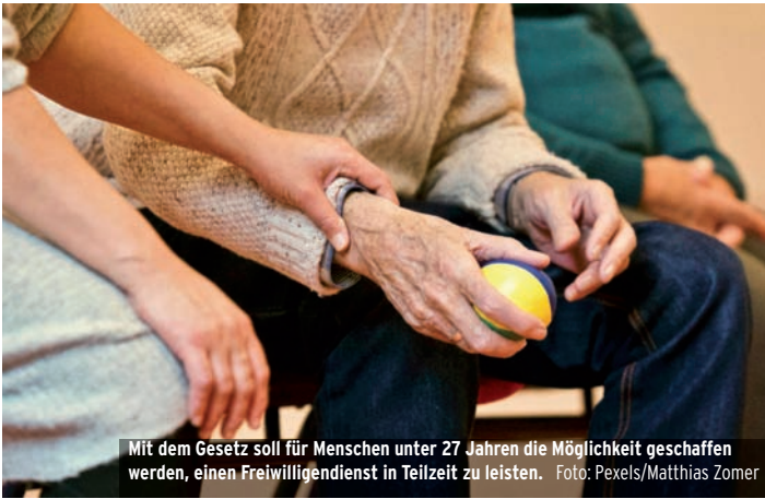
Mit dem Gesetz soll für Menschen unter 27 Jahren die Möglichkeit geschaffen werden, einen Freiwilligendienst in Teilzeit zu leisten.