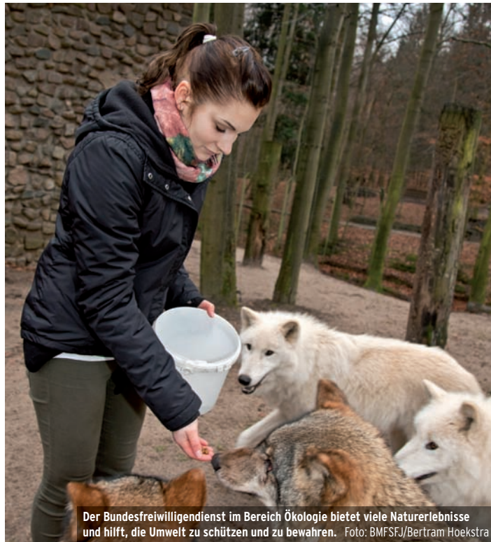
Der Bundesfreiwilligendienst im Bereich Ökologie bietet viele Naturerlebnisse und hilft, die Umwelt zu schützen und zu bewahren.

Freiwilligendienste bieten die Möglichkeit, Erfahrungen zu sammeln