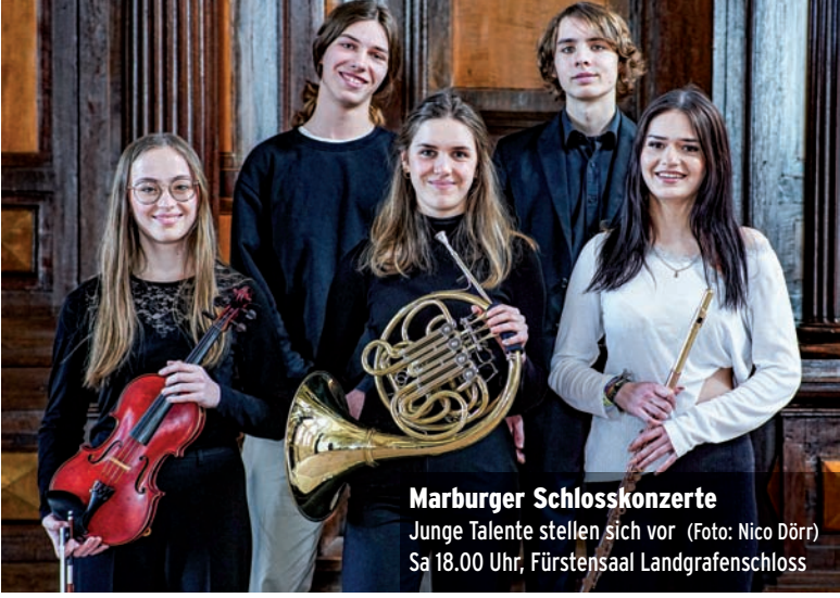
Marburger Schlosskonzerte Junge Talente stellen sich vor Sa 18.00 Uhr, Fürstensaal Landgrafenschloss