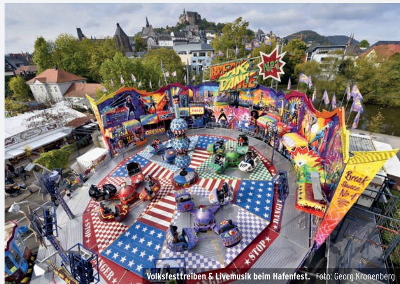
Volksfesttreiben & Livemusik beim Hafenfest.