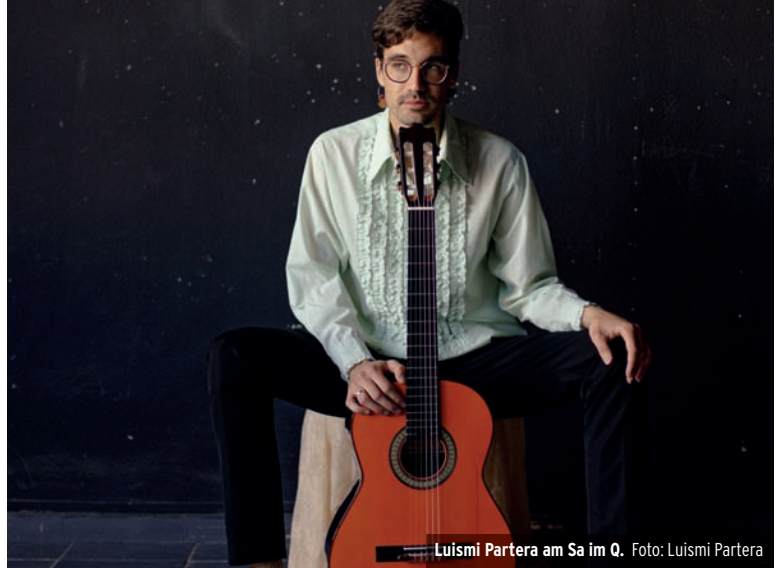
Luismi Partera am Sa im Q.