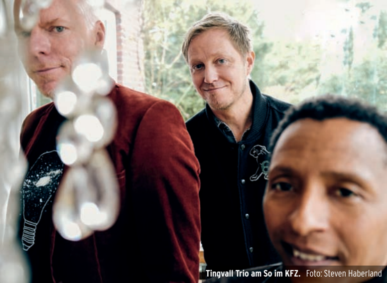
Tingvall Trio am So im KFZ.