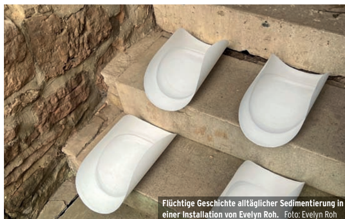
Flüchtige Geschichte alltäglicher Sedimentierung in einer Installation von Evelyn Roh.

Evelyn Roh „Sentiment of Sediments“ Kunsthalle Willingshausen Eröffnung Samstag, 11.5., 16 Uhr Di - Fr 14 - 17 Uhr und Sa / So 10 - 12 & 14 - 17 Uhr