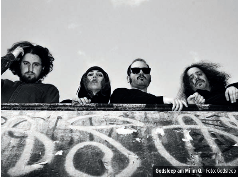
Godsleep am Mi im Q.