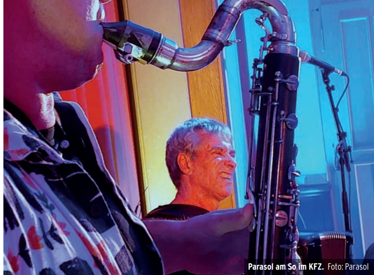
Parasol am So im KFZ.