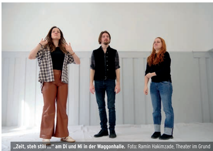
„Zeit, steh still ...“ am Di und Mi in der Waggonhalle.

Seit über 15 Jahren begeistert Lechuga mit einer Mischung aus Ska und Reggae, Rock, Punk, Latin, Balkansounds und Weltmusik. Stilistisch lässt sich die Band zwischen Amparanoia, Los de Abajo, Costo Rico, Panteon Rocòco und vergleichbaren Vertretern der „Mestizo“ und Latin-Ska Landschaft einordnen. Mit ihren eigenen Stücken spielt Lechuga eine Melange aus ausdrucksstarkem gefühlvollem Gesang, kraftvollen melodiosen Bläser-Hooklines und mitreißenden energiegeladenen Rhythmen. Genau die richtige Musik, um damit in den Mai reinzufeiern.