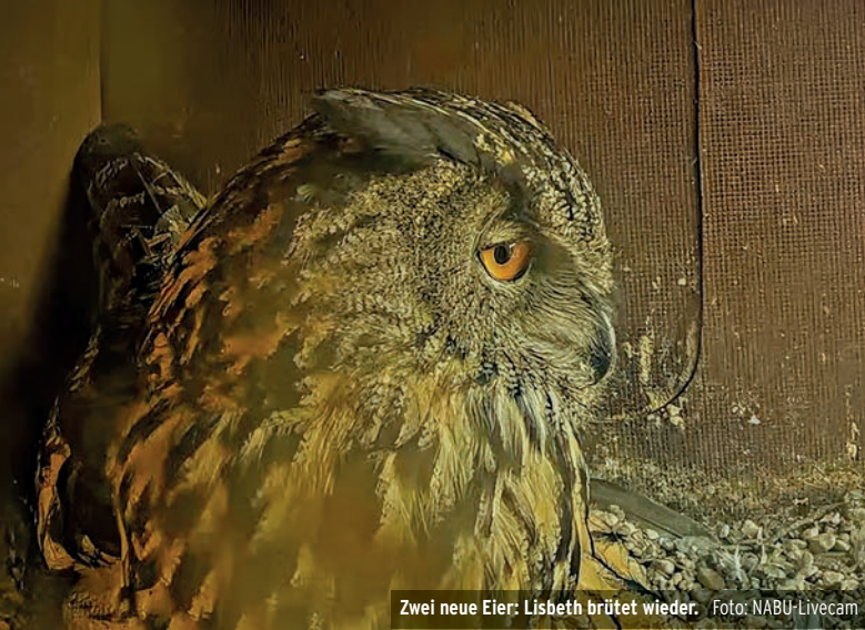
Zwei neue Eier: Lisbeth brütet wieder.