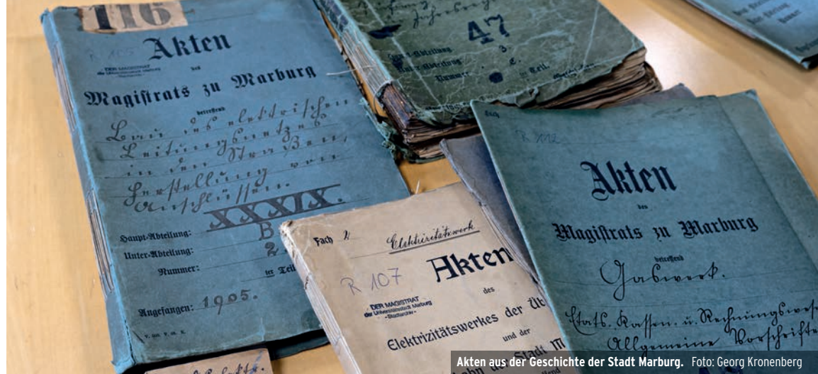
Akten aus der Geschichte der Stadt Marburg.

Zu finden sind aber auch die Nachlässe der DKP, der Marburger Liberalen und des in Marburg geborenen Heinz Düx, der Richter während der Frankfurter Ausschwitzprozesse war. Dazu kommen die Nachlässe von Betrieben wie der früheren Kunsttöpferei