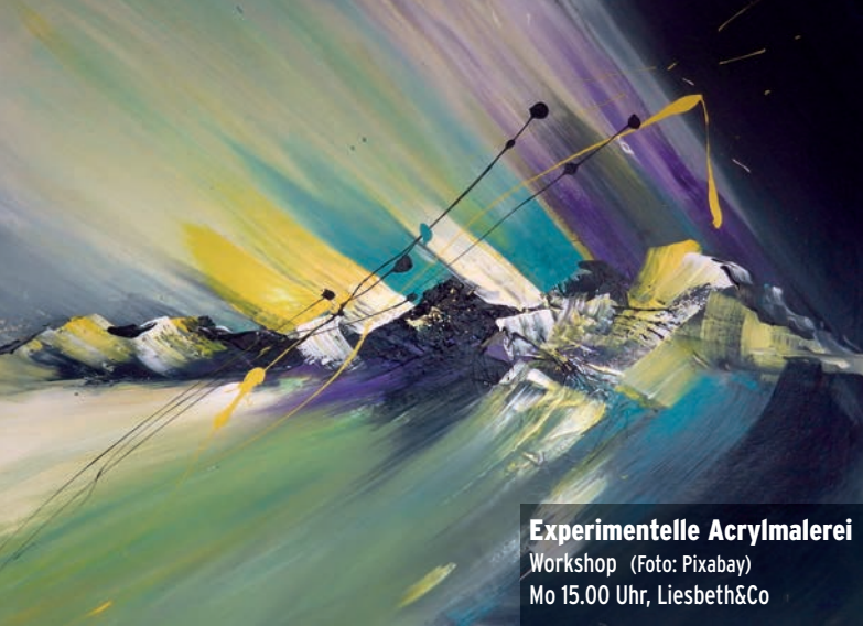
Experimentelle Acrylmalerei Workshop Mo 15.00 Uhr, Liesbeth&Co