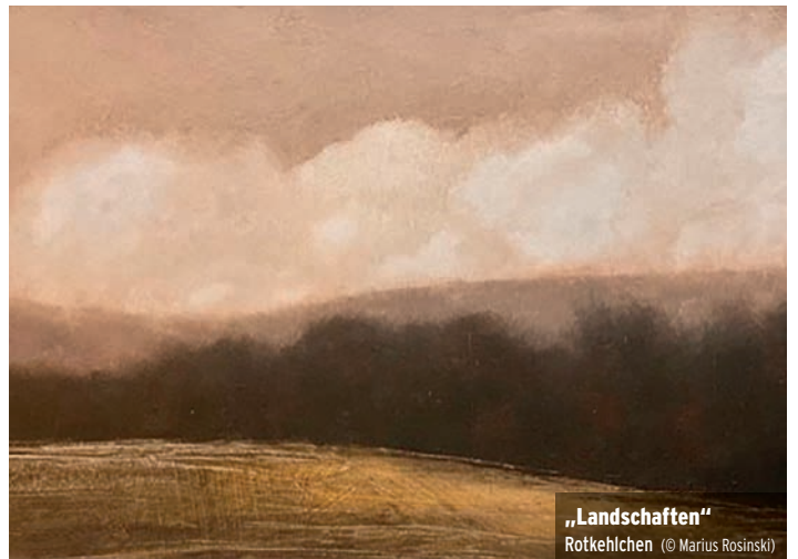
„Landschaften“ Rotkehlchen © Marius Rosinski