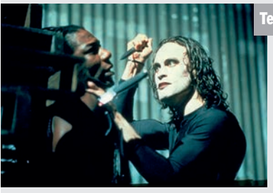
Tele 5 - 22.20 The Crow - Die Krähe

Rocksänger Eric Draven hat eine vielversprechende Karriere vor sich, als er und seine Verlobte am Vorabend von Halloween ermordet werden. In dieser magischen Nacht verwandelt er sich in einen Unverwundbaren und seine Seele sucht sich den Körper einer Krähe aus, um ein Jahr später Vergeltung zu üben.