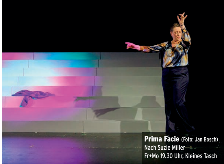
Prima Facie Nach Suzie Miller Fr+Mo 19.30 Uhr, Kleines Tasch