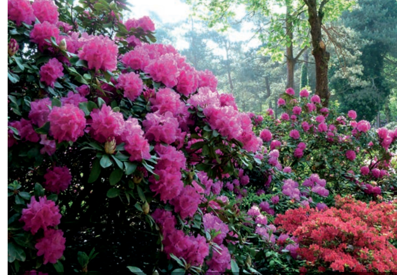
Der Rhododendronwald ist das Thema einer Führung im Neuen Botanischen Garten.