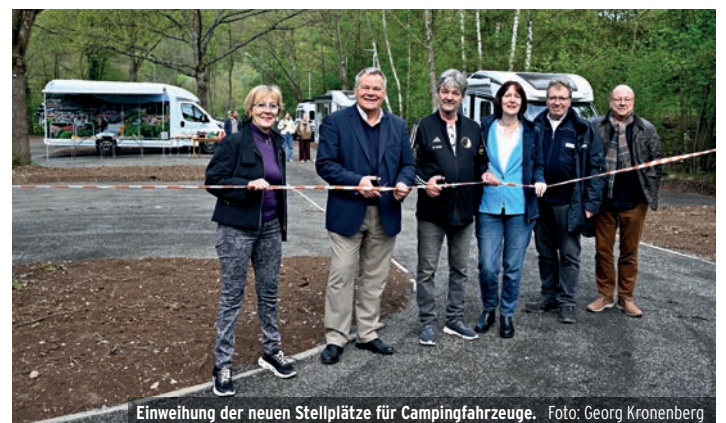
Einweihung der neuen Stellplätze für Campingfahrzeuge.