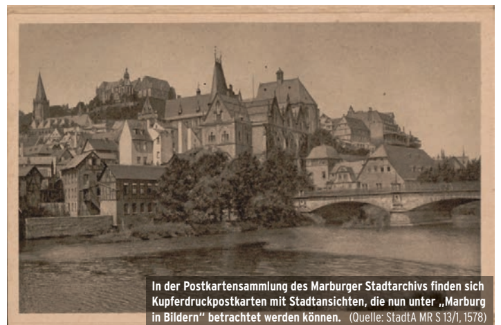
In der Postkartensammlung des Marburger Stadtarchivs finden sich Kupferdruckpostkarten mit Stadtansichten, die nun unter „Marburg in Bildern“ betrachtet werden können.