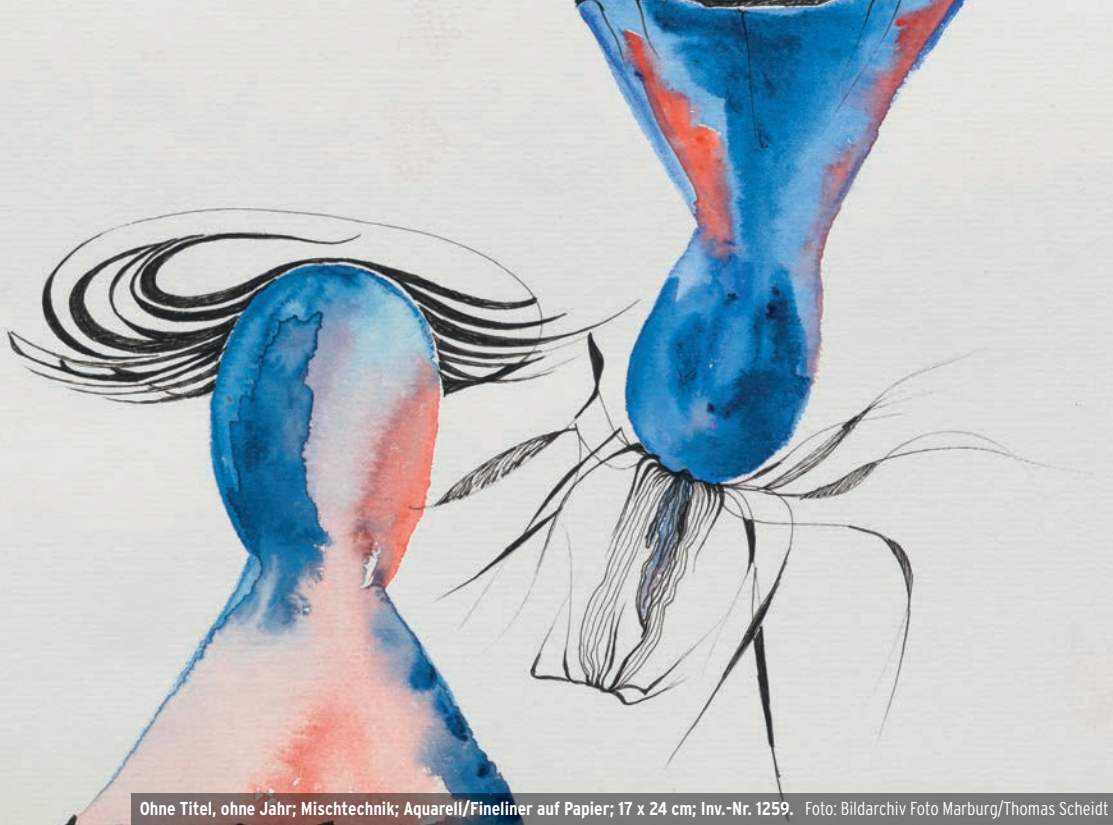
Ohne Titel, ohne Jahr; Mischtechnik; Aquarell/Fineliner auf Papier; 17 x 24 cm; Inv.-Nr. 1259.

res Nachlasses brachte eine schier unerschöpfliche Fülle an Werken ans Licht.