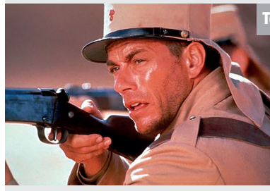
Tele 5 - 20.20 Der Legionär

Marseille, in den 20er-Jahren: Boxer Alain will mit der Geliebten eines Mafia-Bosses durchbrennen, wird aber erwischt. Er flüchtet zu der Fremdenlegion nach Marokko, wo er alsbald an zwei Fronten kämpft. Gegen die Wüstenvölker und gegen die Handlanger des rachsüchtigen Mafiosos...