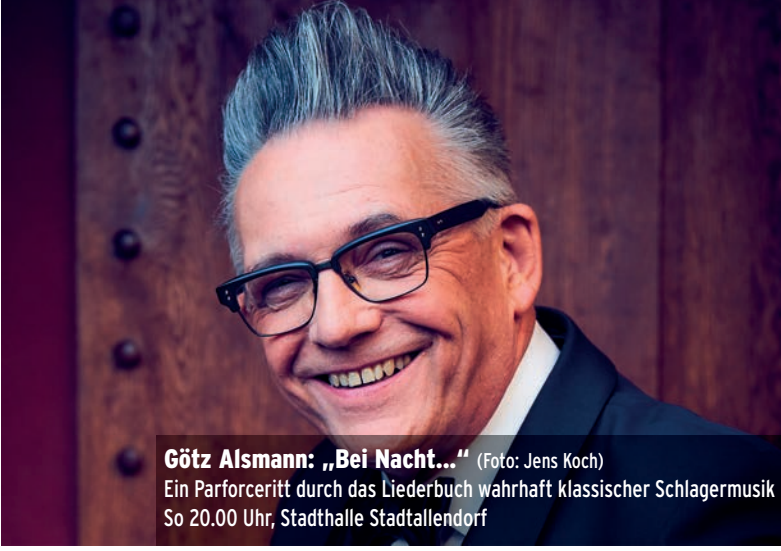
Götz Alsmann: „Bei Nacht...“ Ein Parforceritt durch das Liederbuch wahrhaft klassischer Schlagermusik So 20.00 Uhr, Stadthalle Stadtallendorf