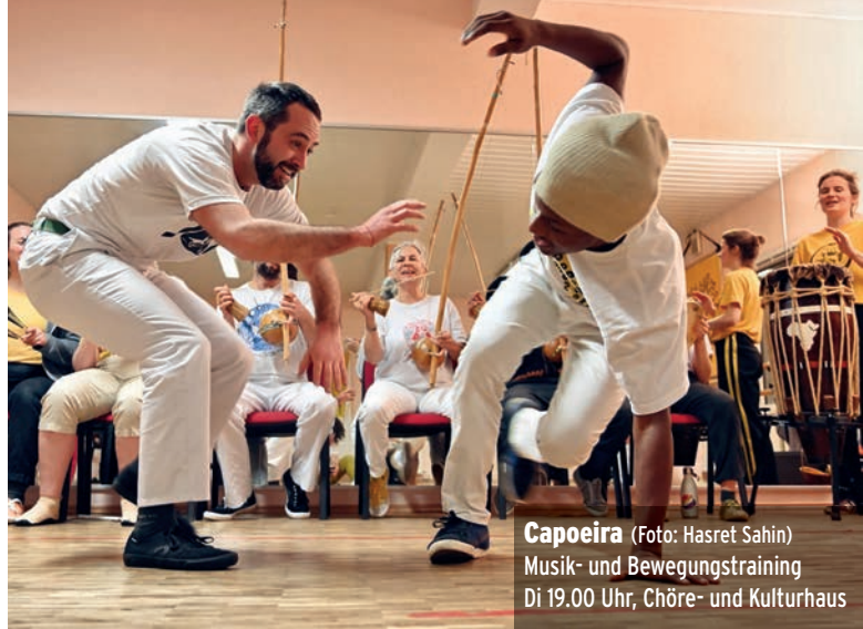
Capoeira Musik- und Bewegungstraining Di 19.00 Uhr, Chöre- und Kulturhaus

Anmeldung. ⊙19.00-20.00 Nachbarschaftszentrum Waldtal, Waidmannsweg 11