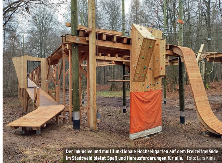
Der inklusive und multifunktionale Hochseilgarten auf dem Freizeitgelände im Stadtwald bietet Spaß und Herausforderungen für alle.