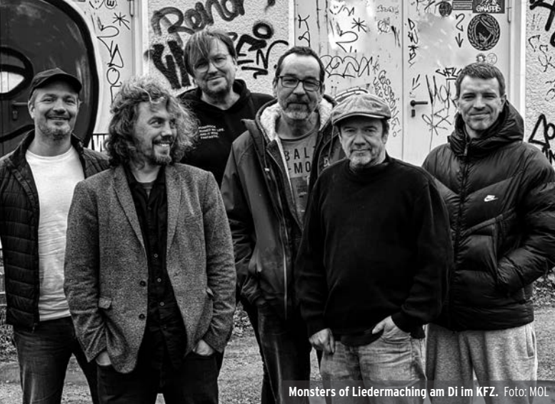
Monsters of Liedermaching am Di im KFZ.