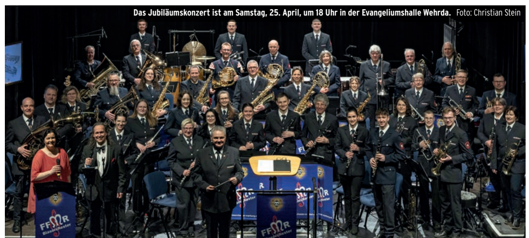
Das Jubiläumskonzert ist am Samstag, 25. April, um 18 Uhr in der Evangeliumshalle Wehrda.