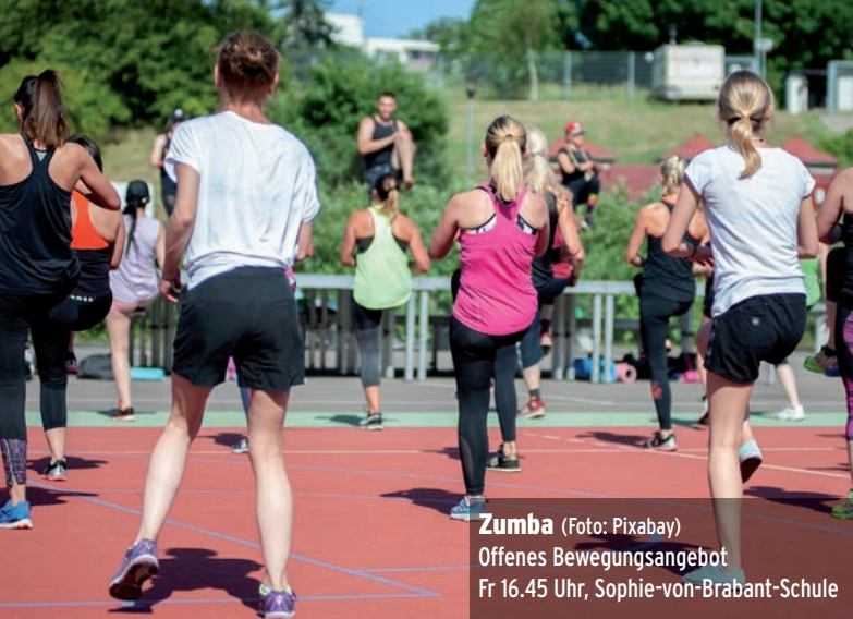
Zumba Offenes Bewegungsangebot Fr 16.45 Uhr, Sophie-von-Brabant-Schule