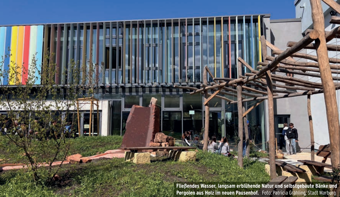
Fließendes Wasser, langsam erblühende Natur und selbstgebaute Bänke und Pergolen aus Holz im neuen Pausenhof.