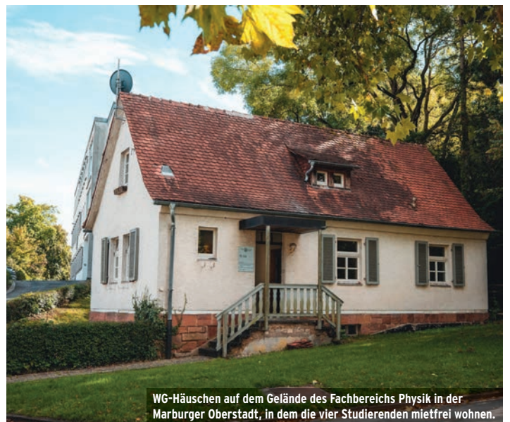
WG-Häuschen auf dem Gelände des Fachbereichs Physik in der Marburger Oberstadt, in dem die vier Studierenden mietfrei wohnen.

Der gemeinsame Kanal der Marburg-WG findet sich unter: www.instagram.com/marburg.wg Auf TikTok und Youtube ist die WG ebenfalls vertreten.