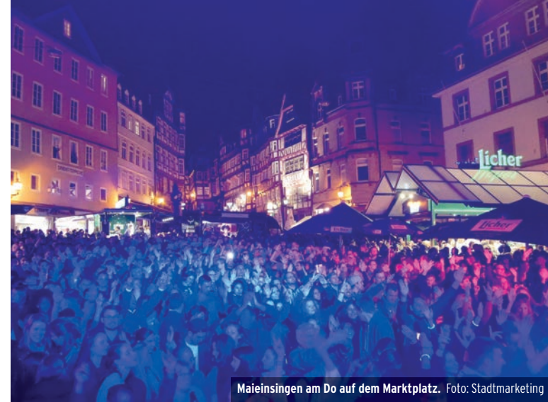
Maieinsingen am Do auf dem Marktplatz.