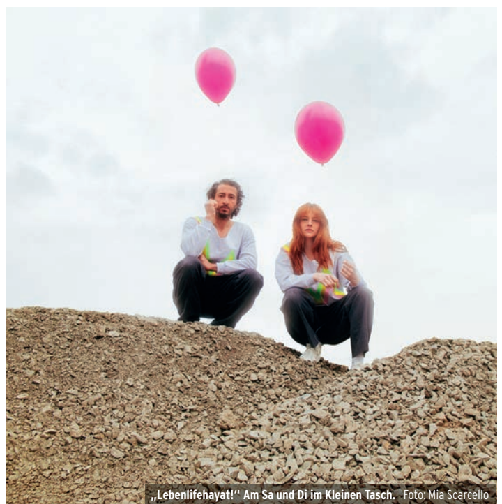
„Lebenlifehayat!“ Am Sa und Di im Kleinen Tasch.